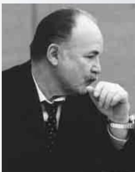
НИКОЛАЙ НИКОЛАЕВИЧ ГУБЕНКО

Первый заместитель председателя ЦК КПРФ, профессор МГУ