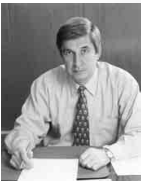
ИВАН ИВАНОВИЧ МЕЛЬНИКОВ

Первый заместитель председателя ЦК КПРФ, профессор МГУ