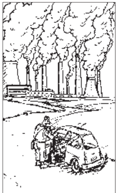
РИСУНОК АЛЕКСАНДРА ПАШКОВА