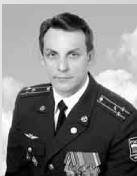
ВЛАДИМИР ДМИТРИЕВИЧ УЛАС

Народный артист РСФСР, лауреат Государственной премии РСФСР и премии Ленинского комсомола