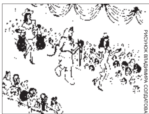
РИСУНОК ВЛАДИМИРА СОЛДАТОВА

С одной стороны, если можно жить без женщин, то кто будет стирать, ходить по магазинам, заниматься с детьми, готовить, убирать квартиру, приносить зарплату?