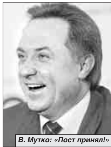
В. Мутко: «Пост принял!»