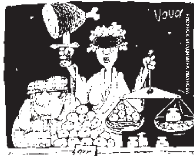
РИСУНОК ВЛАДИМИРА ИВАНОВА

Сегодня купить можно все - от ананаса и рябчика до депутата и судьи. Продается тоже все - «мерседесы», гостайны, виллы, совесть, должности и что пожелаете.