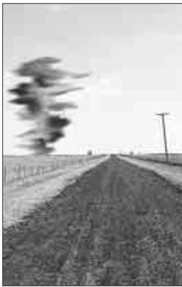
КОЛЛАЖ АНДРЕЯ НИКЕРИЧЕВА

рое закручивается в воронку. Из нее к земле с ревом спускается хобот, достигающий в диаметре десяти метров. Если уж оно встретилось на пути, главное, чтобы это ветренное чудовище вас не закрутило. Определите направление ветра и что есть мочи бегите перпендикулярно ему. Если это произошло в городе, забегайте в первый попавшийся подъезд. В открытой местности - прыгайте в ближайшую яму. Смерч имеет свойство как бы перепрыгивать через любые относительно крупные впадины.