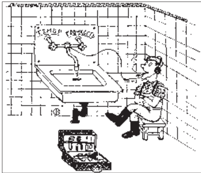
РИСУНОК ВЛАДИМИРА СОЛДАТОВА