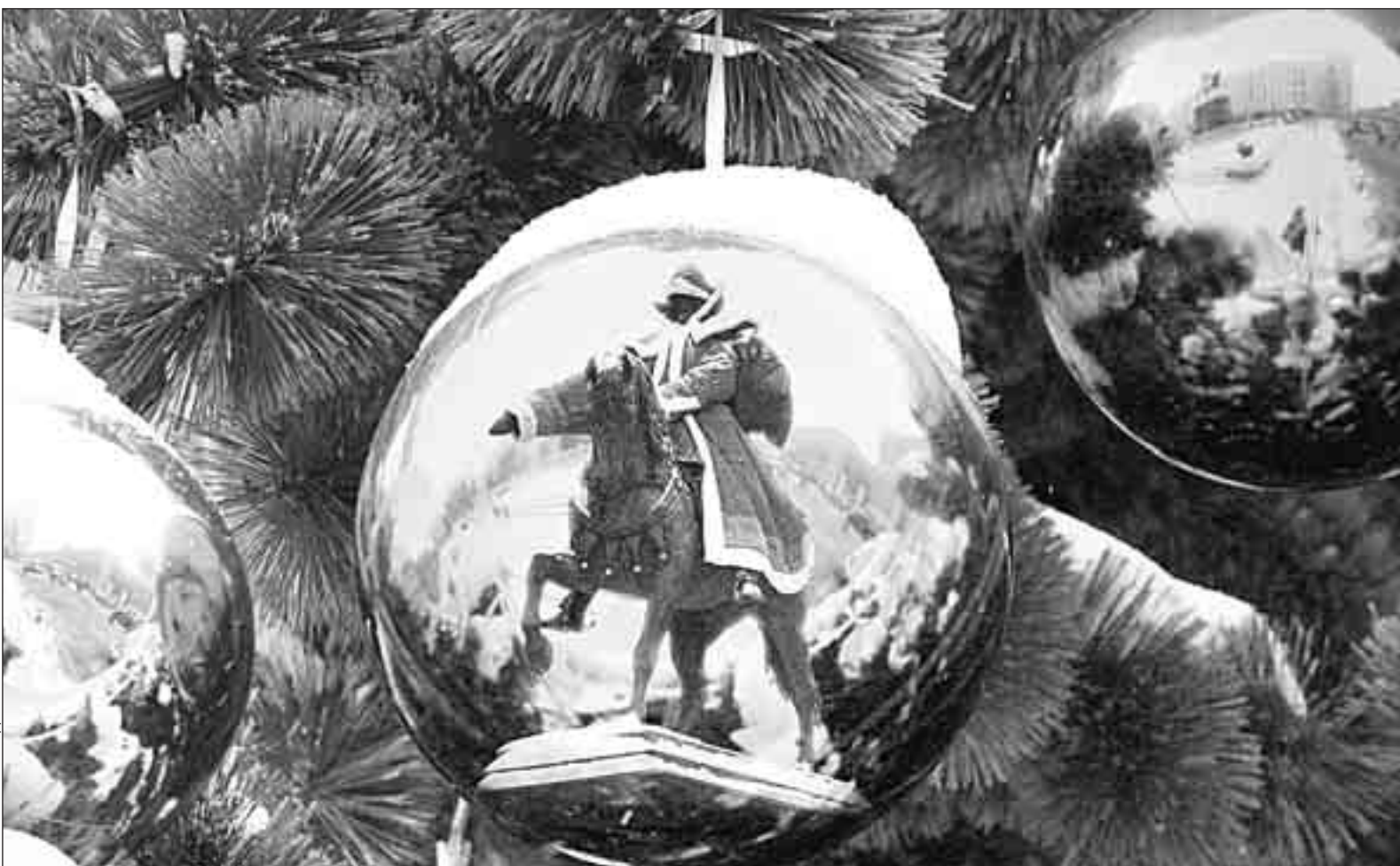
КОЛЛАЖ АЛЕКСАНДРА МАТЮШКИНА