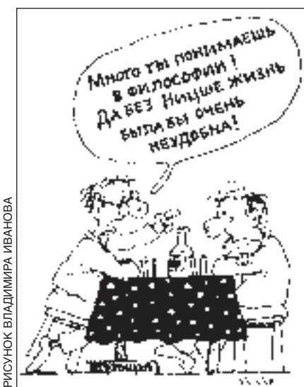
РИСУНОК ВЛАДИМИРА ИВАНОВА