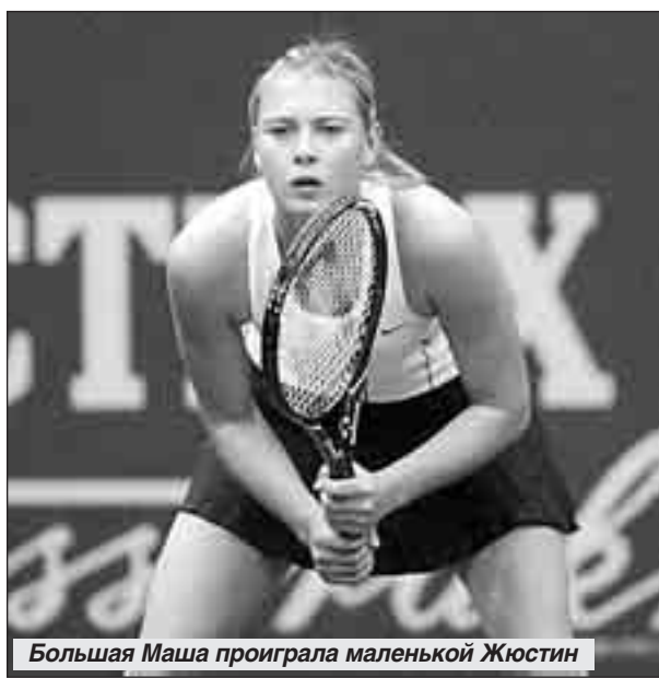
Большая Маша проиграла маленькой Жюстин

хотя первый сет остался за киприотом - 7:5. Дальше солировал Федерер - 7:5, 6:0, 6:2.