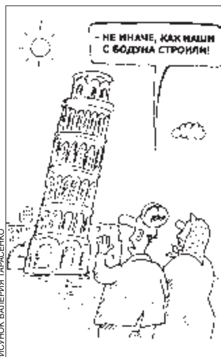
РИСУНОК ВАЛЕРИЯ ТАРАСЕНКО

В семье Кузьякиных царил домашняя идиллия.