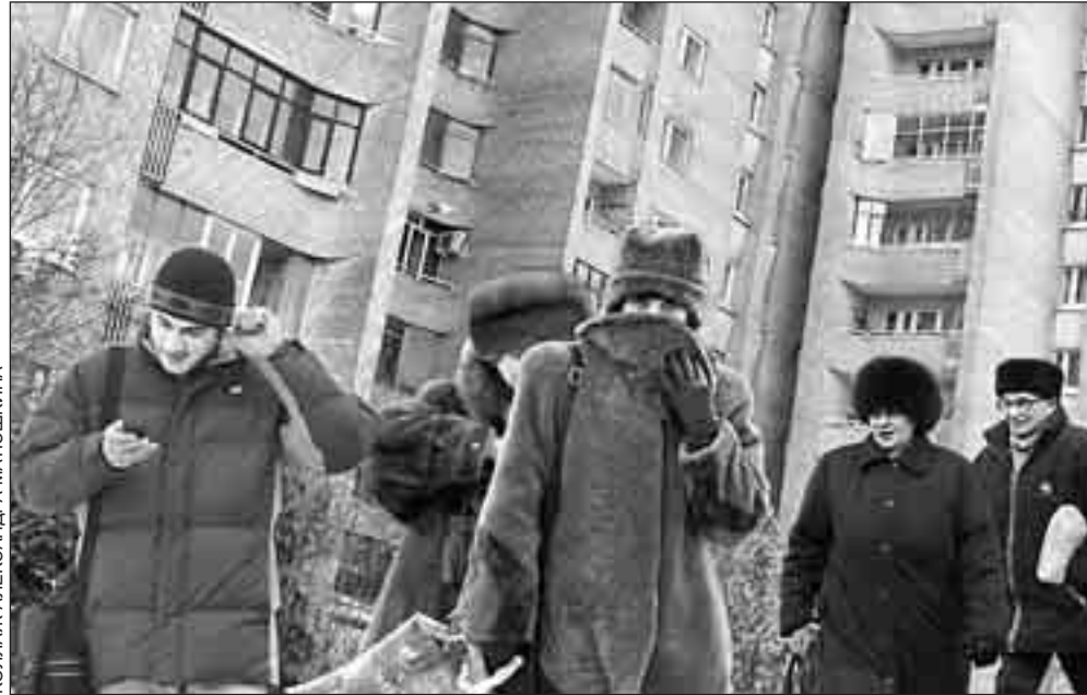
КОЛЛАЖ АЛЕКСАНДРА МАТЮШКИНА

Игорь Иванович сообщил, что на национальные проекты выделено 180 млрд. рублей. И отметил, что самый сложный проект – по жилью, потому что в этой сфере много заскорузлых проблем. Это сообщение вселяло оптимизм: стало быть, если такое внимание жилищному национальному проекту, то