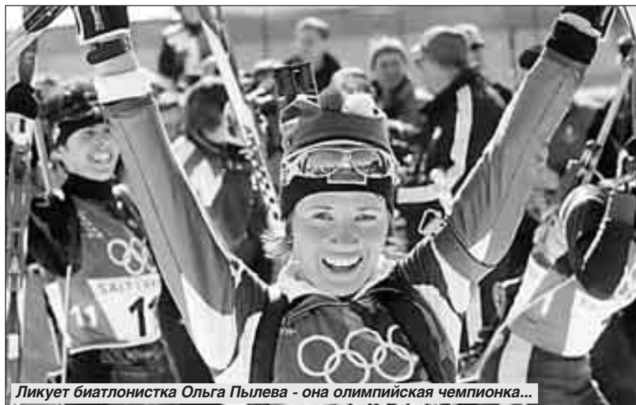
Ликует биатлонистка Ольга Пылева - она олимпийская чемпионка...