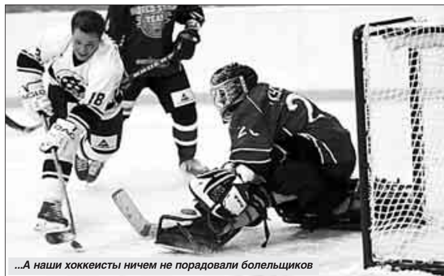
...А наши хоккеисты ничем не порадовали болельщиков

Считанные дни остались до открытия зимних Олимпийских игр в итальянском Турине. Одними из главных претендентов на медали будут, безусловно, что бы там ни говорили, российские спортсмены. Вспомним, как складывались события для наших кумиров, их многочисленных поклонников четыре года назад, на аналогичных стартах в американском Солт-Лейк-Сити.