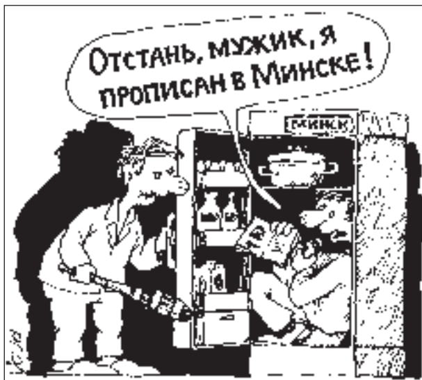
РИСУНОК ВЛАДИМИРА ИВАНОВА

Хлопотливая супруга не очень известного литератора Рычкова подошла к мужнину столу, протерла тряпочкой ряды ледяных папок с рукописями, стекла книжного шкафа, блестящую лысину самого литератора, мельком взглянула на лежащую перед супругом страничку и замерла.