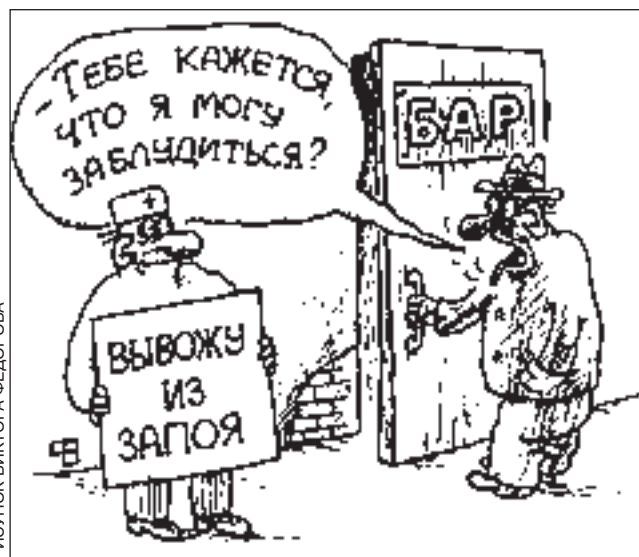
РИСУНОК ВИКТОРА ФЕДОРОВА