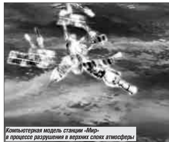
Компьютерная модель станции «Мир» в процессе разрушения в верхних слоях атмосферы