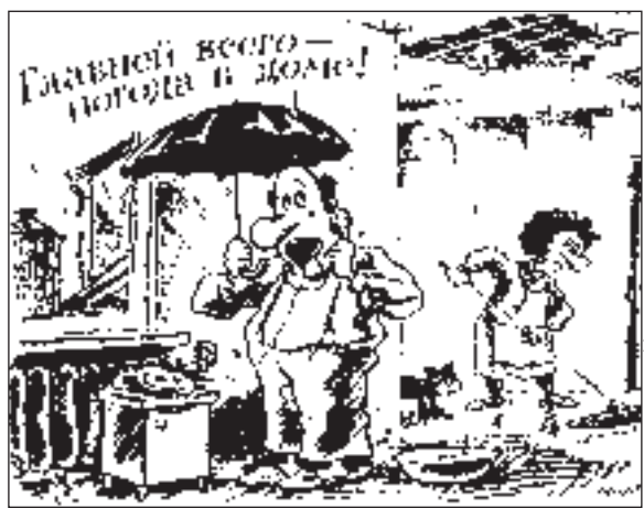
РИСУНОК ВЛАДИМИРА МИЛЕНКО