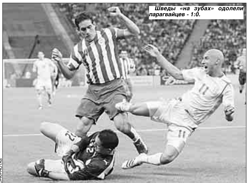
Шведы «на зубах» одолели парагвайцев - 1:0.

Самое же горькое разочарование постигло болельщиков постсоветского пространства, когда украинцы с неприличным счетом - 0:4 уступили испанцам. Не верится, что разница в классе именно такая - команда, ведомая Олегом Блохиным, обыграла в от-