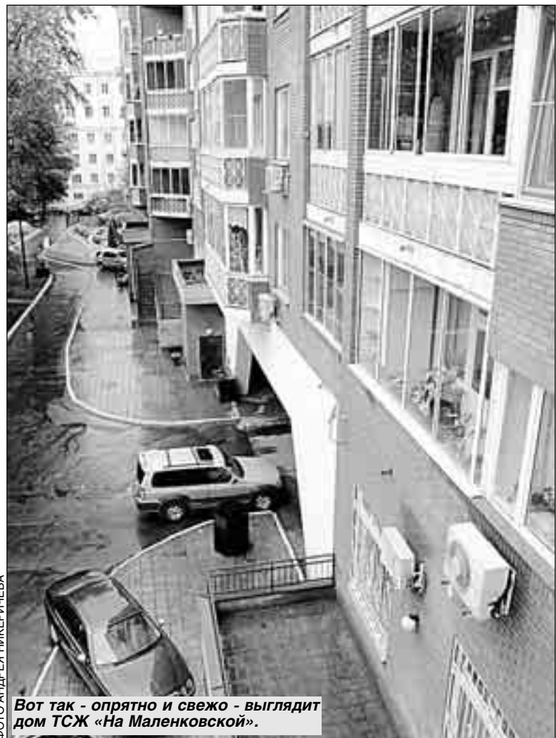
Вот так – опрятно и свежо – выглядит дом ТСЖ «На Маленковской».