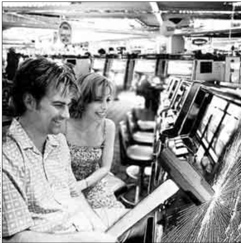
КОЛЛАЖ АНДРЕЯ НИКЕРИЧЕВА

Куда направить розыск, где искать преступника? Видеозапись была существенным подспорьем, но указать место, где скрывается убийца, она не могла. Не нашлось и свидетелей происшествия. Не опознали неизвестного злодея и те, кто живет или работает в соседних домах. Неожиданную помощь сыщики получили от чудом выжившего кассира. Врачи буквально вытащили его с того света. Несколько недель он пролежал в коме и постепенно стал реагировать на окружающий мир.