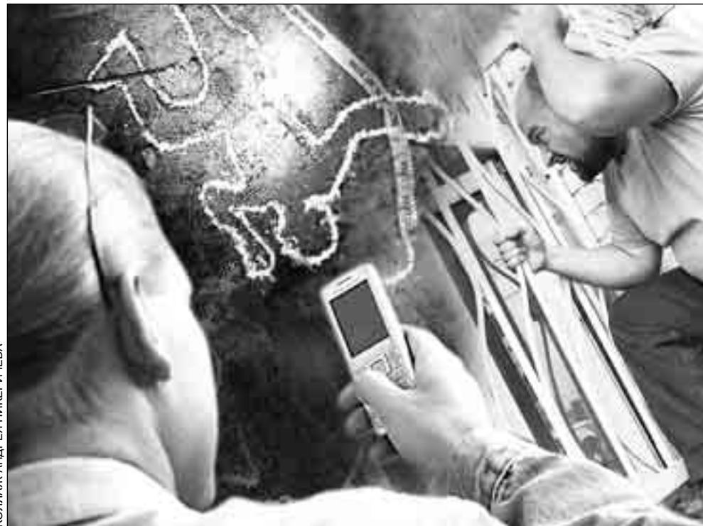
КОллаж: АНДРЕЙ НИКЕРИЧЕВА

Чуть более суток потребовалось сотрудникам МУРа, чтобы раскрыть жестокое убийство четырех москвичей.