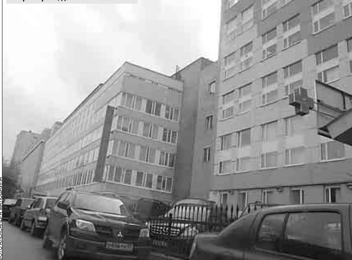
Раньше здесь сиял «Маяк». Теперь - крест, да и тот - маленький

С 1943 года «Маяк» производил и ремонтировал агрегаты, без которых немислима была не только военная авиация страны. Предприятие было монополистом в изготовлении спецтехники и электрооборудования, от него зависела работа танкостроительных, судостроительных, ремонтных и других предприятий. Без изделий завода до сих пор в российское небо не поднимается ни один самолет. Вертолеты, самолеты новейшего поколения, гражданские авиалайнеры - на них установлены агрегаты, обеспечивающие надежную эксплуатацию. Но... такое сейчас время: о безопасности, и не только в отдельно взятом случае, а в масштабах государства, мы почему-то вспоминаем только тогда, когда случаются трагедии.