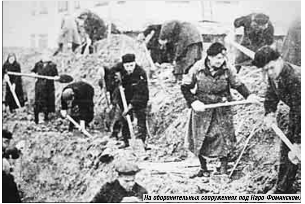
На оборонительных сооружениях под Наро-Фоминском.