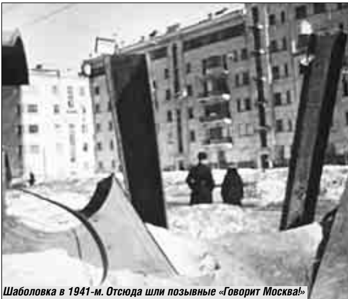
Шаболовка в 1941-м. Отсюда шли позывные «Говорит Москва!»