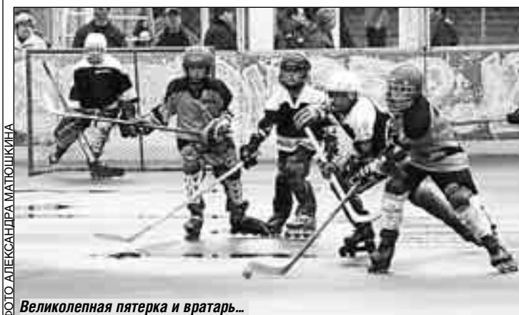
Великолепная пятерка и вратарь...