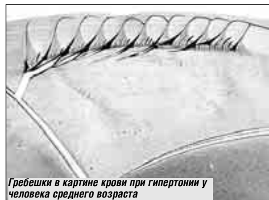
Гребешки в картине крови при гипертонии у человека среднего возраста

Сейчас распознаются по капле больше 20 заболеваний или подступов к ним. Одно из важнейших достижений последнего времени - открытие маркеров раннего злокачественного роста. Вряд ли нужно доказывать, как важно принять меры на самой ранней стадии, когда можно остановить развитие болезни и сохранить человеку жизнь. Ведь в большинстве случаев онкологам приходится иметь дело с уже сложившимся, прогрессирующим заболеванием. Ученые институтом распознают и доброкачественный рост, и риск его перехода в злокачественный, диагностируемый на молекулярном уровне. Пока это предварительные исследования, но в лаборатории насчитывают уже десятки наблюдений, когда люди вняли рекомендациям ученых, приняли меры и избавились от угрожающего им рака. Ученые надеются, что со временем их метод будет внедрен в широкую клиническую практику и диспансеризацию населения. Ведь для этого всего-то нужно взять каплю крови. Не требуется ни больших расходов, ни сложной аппаратуры.