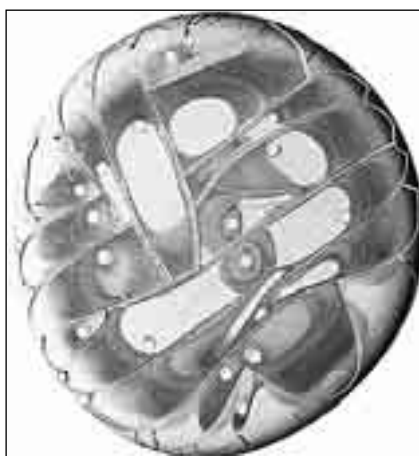
Дисгармония на картине крови здорового человека. Имеются сбои в работе органов и систем

тижениям по неинвазивной (без внутреннего вмешательства) диагностике. Ученые обратились к серьезным заболеваниям почек,