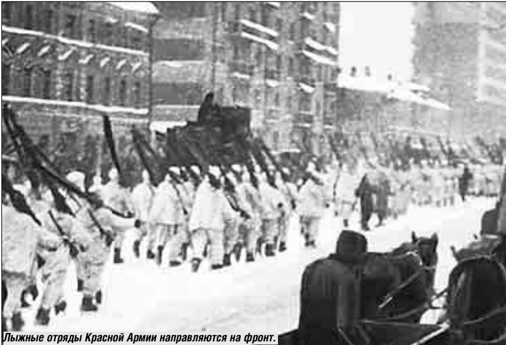
Лыжные отряды Красной Армии направляются на фронт.