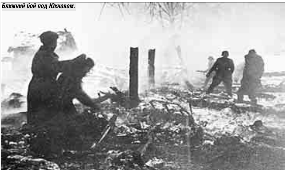
Ближний бой под Юхновом.