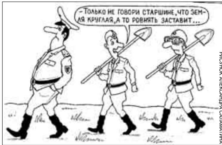
РИСУНОК АЛЕКСАНДРА СИДАЛАНТИНОЙ