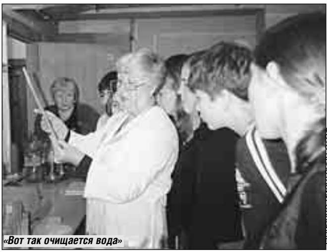
«Вот так очищается вода»

Российские операторы местной телефонной связи (в нашей стране их восемь) переходят на качественно иную систему расчетов с абонентами. Отныне платить за пользование стационарным телефоном придется по выбранным самим абонентом тарифным планам. Собственно говоря, эти тарифные планы – не самостоятельность операторов связи. Данный порядок расчетов предусматривается Федеральным законом «О связи». Статья 54 закона, в частности, гласит: «Оплата местных телефонных соединений производится по выбору абонента-гражданина с применением абонентской или повременной системы оплаты».