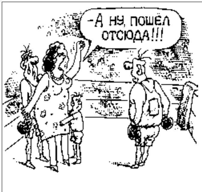
РИСУНОК ВИКТОРА ФЕДОРОВА