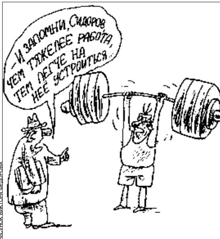
РИСУНОК ВИКТОРА ФЕДОРОВА

- Иван Иванович, подпишите... - Что это? - Кредитик. Беспроцентный. На развитие конного спорта. - Кредитик? Беспроцентный?! Вы что, сена объелись? Даже копытом не пошевелю! - Ну, Иван Иванович... Очень-очень надо. Лошадки голодают. - А вы мне тут не рысачьте! Я сам голодаю! Много вас