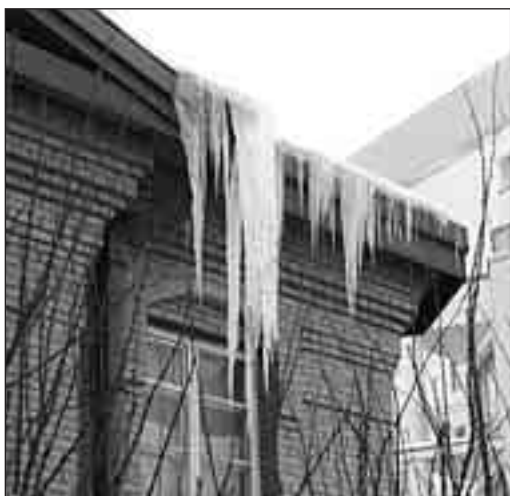
Более подробную информацию о состоянии погоды можно получить круглосуточно по мобильным телефонам: МТС, БИ-Лайн, Мегафон - 0656.

Атмосферное давление в середине недели приблизится к своей климатической норме. Однако из-за низкой температуры воздуха не лучшим образом могут чувствовать себя лица, склонные к спастическим реакциям. Особенно велика их вероятность в ранние утренние часы при выходе из теплого помещения на улицу. В конце недели (2-5 марта) из-за колебаний основных метеорологических параметров может ухудшиться самочувствие метеочувствительных людей. Не помешает подкрепить организм поливитаминами.