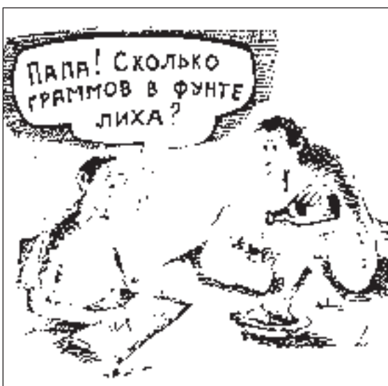
РИСУНОК АЛЕКСАНДРА ПРОХОРОВА