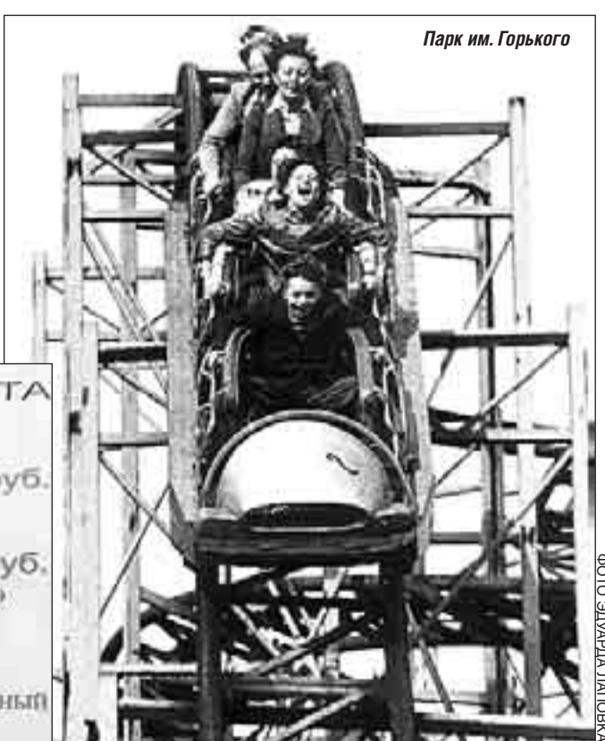
Парк им. Горького