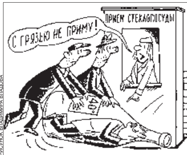
РИСУНОК ВЛАДИМИРА ВЛАДИМЕРОВА

Т ут у меня трубу прорвало. Вода хлещет, по комнатам обувь пла- вает... Звоню в диспетчерскую, говорю: так, мол, и так, впору аква- ланг покупать, того и гляди телевизор смоев в форточку... Ну они мне квар- тире и обезводили.