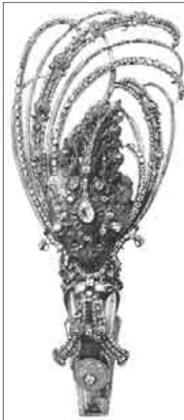
Сильного. Камень исключительной чистоты и веса (41 карат) получил необычную селадонно-зеленую окраску в ре-