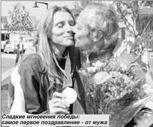
Сладкие мгновения победы: самое первое поздравление - от мужа

- Видите ли, я от случая к случаю уже выступала в периодической печати. Но считаю это по большому счету несерьезным. Журналистикой, как и любой профессией, надо заниматься по полной программе, без всяких скидок на занятость и другие «привходящие» моменты. Пока я не ушла из легкой атлетики, ни о какой глобальной пробе пера не должно быть и речи. Вот когда повешу кроссовки на гвоздь, тогда, может быть, вольюсь в ваши ряды. Но, скорее всего, стану тренером или преподавателем на родном мне факультете журналистики.