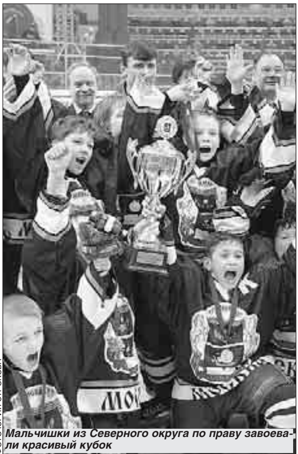
Мальчишки из Северного округа по праву завоевали красивый кубок