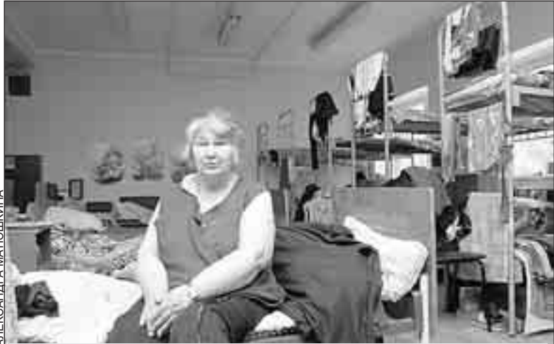
В Центре социальной адаптации «Люблино» людям, по разным причинам потерявшим свой кров, а с ним и надежду на будущее, помогают начать новую жизнь

В ладимир Александрович, если судить по официальным данным, зарплаты в России год от года растут. Тем не менее проблема бедности населения не становится менее острой. С чем это связано?