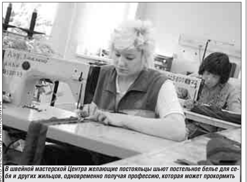
В швейной мастерской Центра желающие постояльцы шьют постельное белье для себя и других жильцов, одновременно получая профессию, которая может прокормить

Покупательная способность населения в нижней «десятке» не растет уже целых 15 лет. Неимущие в разные годы способны были купить от 0,45 до 0,59 минимального набора так называемой потребительской корзины. У 15 миллионов человек в России доходы составляют 50-60 долларов в месяц. Эту цифру подтверждают даже в ведомстве Грета. А 2 доллара в день означают, по мировым меркам, абсолютную нищету. В Европе планка нищеты находится на отметке 4 доллара в день. Как раз столько имеют те 10 процентов россиян, которые дотягивают до прожиточного минимума. Отсюда следует, что 30 миллионов наших сограждан должны быть причислены к бедным. 15 миллионов - к очень бедным, 15 миллионов - к просто бедным. Увы, ситуация именно такова. Факты - вещь упрямая.