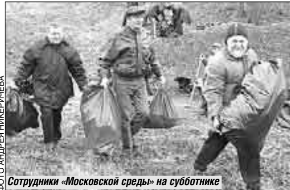
Сотрудники «Московской среды» на субботнике