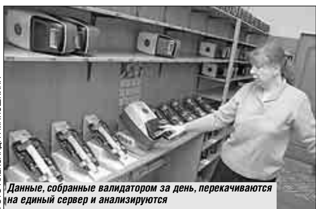
Данные, собранные валидатором за день, перекачиваются на единый сервер и анализируются

Словом, деньги, с которых началась эта история, в ней же поставили очередной знак препинания. Но это еще не точка, потому что расчет за проезд - не