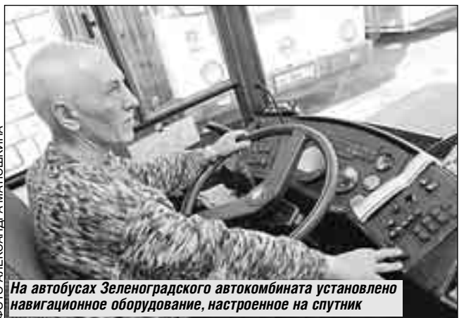
На автобусах Зеленоградского автокомбината установлено навигационное оборудование, настроенное на спутник