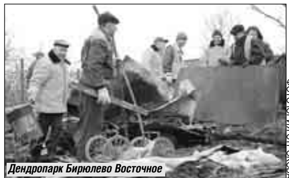
Дендропарк Бирюлево Восточное