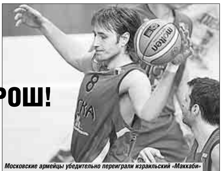
Московские армейцы убедительно переиграли израильский «Маккаби»

Армейцы, по сути, уже в первой четверти при бурной поддержке своих болельщиков решили судьбу поединка, набросав в корзину гостей аж 32 очка! В ответ получили только 13. В кольцо «Маккаби» залетали мячи на любой вкус, конечно, особенно эффектно смотрелись трехочковые броски, их москвичи совершали без дрожи в руках и коленках. Игроки «Маккаби» выглядели беспомощными и растерянными, в какие-то эпизоды их было даже жалко. Некогда сильнейшая команда континента безнадежно капитулировала. Иногда разница в счете, достигавшая неприличных для подобного уровня встреч 30 очков, сокращалась, к примеру, до 20, являясь слабым утешением для гостей и их немногочисленных болельщиков.