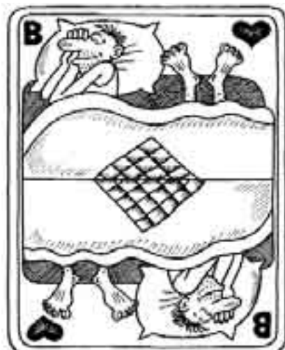
РИСУНОК ПАВЛА ВИНЮГАНОВА