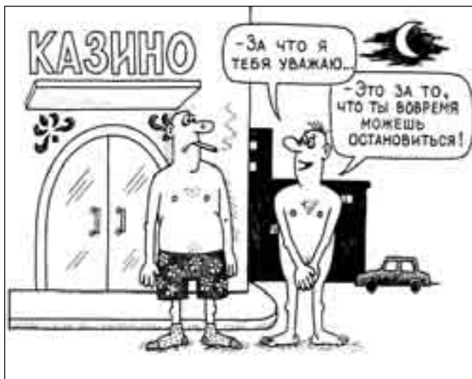
РИСУНОК ПАВЛА ВИНЮГАНОВА

- Начините! - улыбнулся сосед. - Апатиты! - выдохнул Бухарцев.