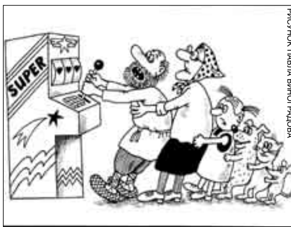
РИСУНОК ПАВЛА ВИНЮГАНОВА