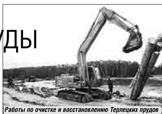
Работы по очистке и восстановлению Терлецких прудов

В области реконструкции водных объектов тоже были нововведения. Впервые очистка дна Верхнего пруда в Царицыне производилась без сброса воды. В прошлом году