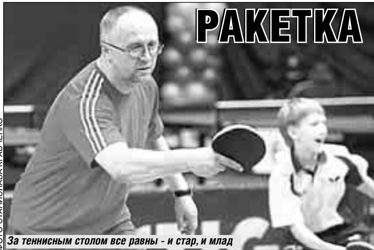
За теннисным столом все равны - и стар, и млад