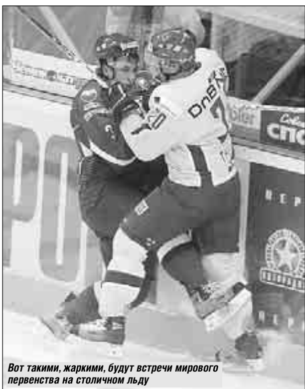
Вот такими, жаркими, будут встречи мирового первенства на столичном льду

ваться на сбор мастера, выступающие в заокеанских клубах - Овечкин, Фролов, Марков. Для них сезон в НХЛ завершился, их команды вылетели из погони за Кубком Стэнли.