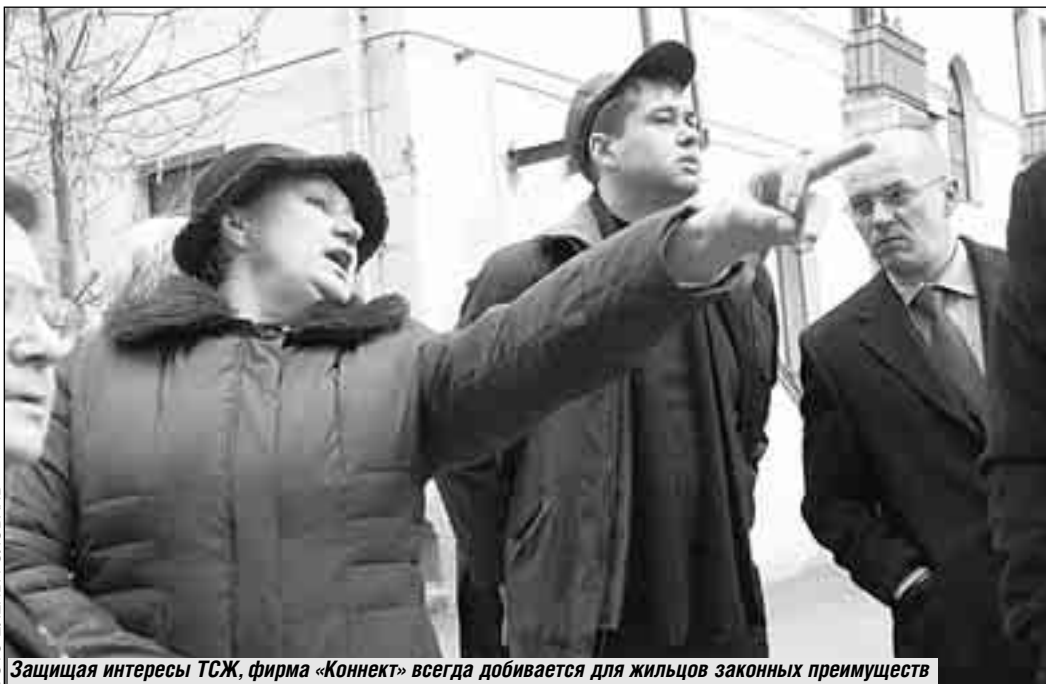
Защищая интересы ТСЖ, фирма «Коннект» всегда добивается для жильцов законных преимуществ

дят посетители – значит, надо чаще мыть подъезд. Больше пользуются лифтом, что, понятно, укорачивает его жизнь. Их не волнует экономия воды, и пусть расчет идет по счетчикам, все равно инженерные системы изнашиваются скорее. Стало быть, и вклад арендаторов в общую кассу должен быть выше. Заботу об этом тоже взял на себя «КОННЕКТ».