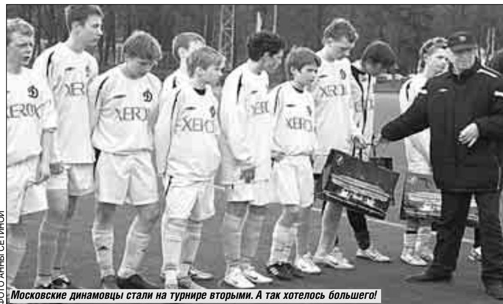
Московские динамовцы стали на турнире вторыми. А так хотелось большего!

Главная спортивная арена страны - Лужники - снова принимала юных атлетов, на сей раз футболистов. Организаторами международного юношеского турнира (возраст игроков не превышал 15 лет) как раз и стали руководители Лужников, тренеры одной из самых популярных на территории СНГ футбольной школы молодежи (ФШМ) «Торпедо».