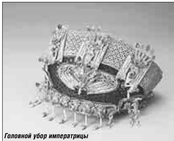
Головной убор императрицы