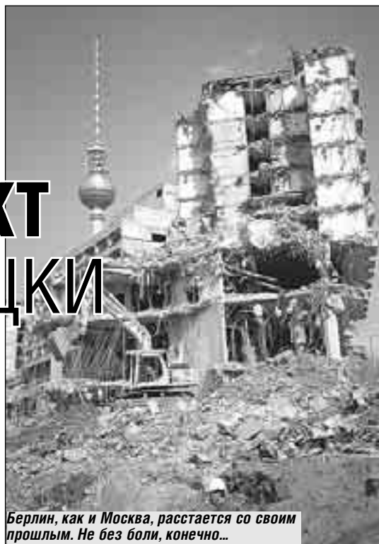
Берлин, как и Москва, расстается со своим прошлым. Не без боли, конечно...

В отличие от нас в Германии жилье передавали в частные руки не бесплатно. Не было там и повальной приватизации. Жильцам было предложено либо выкупить весь дом целиком, взяв льготные кредиты, либо стать квартиросъемщиками у нового владельца дома. Новыми владельцами нередко выступали частные лица и фирмы из Западной Германии. Государство выделяло им кредиты (то есть как бы продавало дом в рассрочку), предоставляло налоговые льготы с условием, что домовладелец проведет полную санацию дома. Сейчас налоговыми