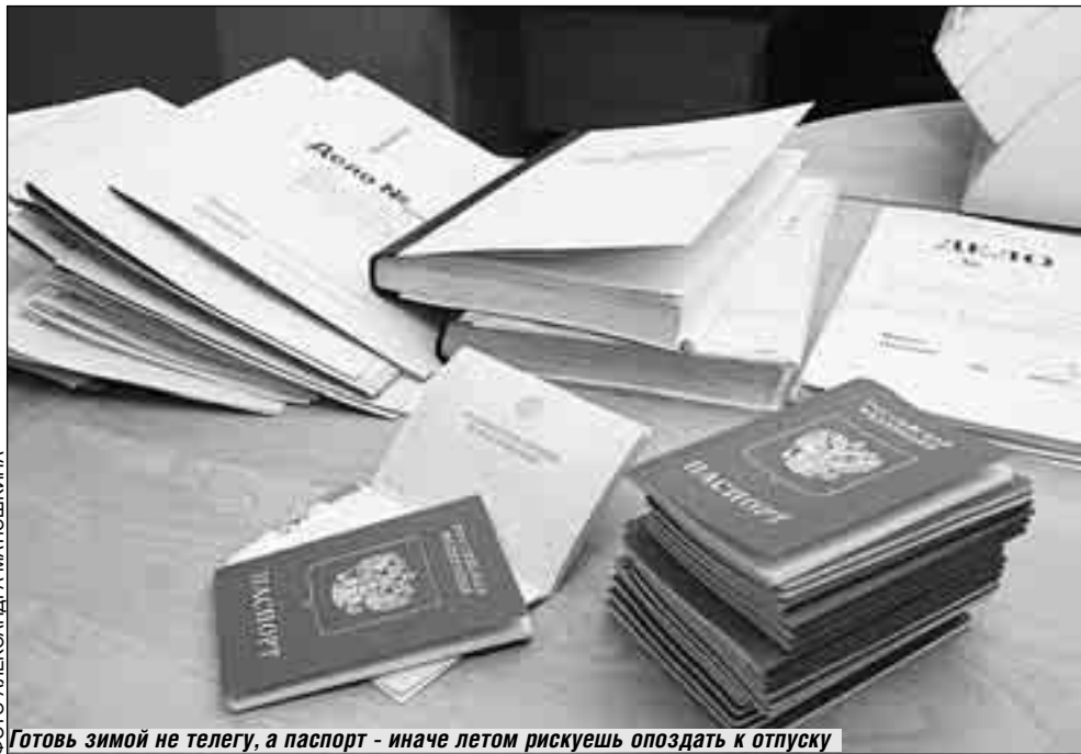
Готовь зимой не телегу, а паспорт – иначе летом рискуешь опоздать к отпуску