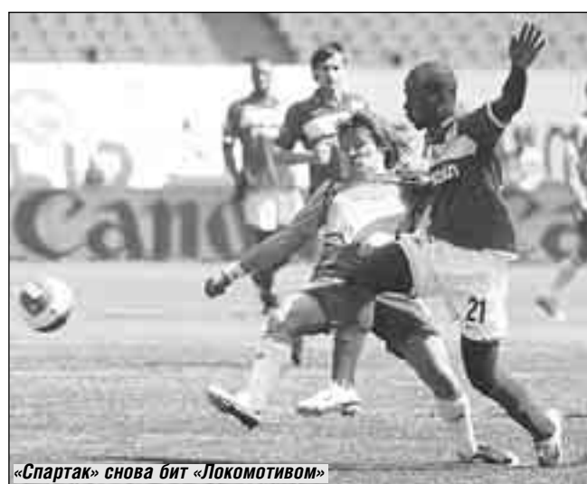
«Спартак» снова бит «Локомотивом»

- Не стану этого делать, зачем рекламировать? К сожалению, люди, употребляющие данные препараты гормонального свойства, и без подсказки доктора знают их названия. Страдают от них не только бодибилдеры, но и борцы, боксеры, среди которых есть и девушки. У легкоатлетов-любителей я иногда вижу флакончики с энергетическими напитками, используемыми профессиональными атлетами. Спрашива-