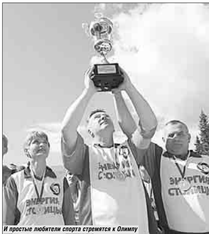
И простые любители спорта стремятся к Олимпиаде

- Ничего подобного! Мы, кстати, приглашаем профессиональных арбитров со стороны, оплачиваем их труд. В частности, Федерация настольного тенниса предоставляет нам судей, и, как правило, никаких недомолвок, обид. Все честно, благородно. Да и, знаете, победа - не самоцель. Народ приезжает пообщаться в выходные, кроме соревнований программа есть еще много привлекательных моментов.