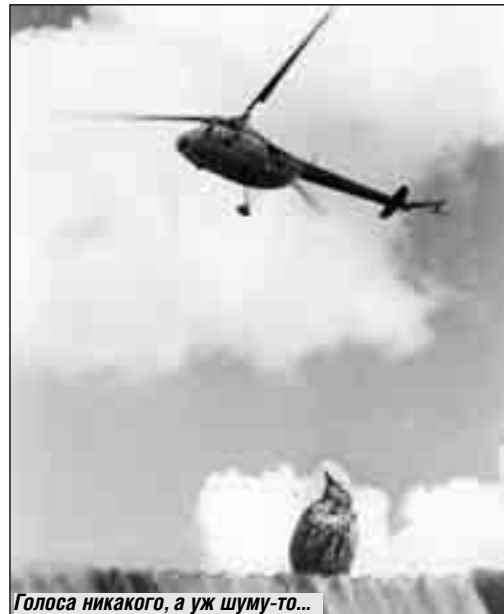
Голоса никакого, а уж шуму-то...