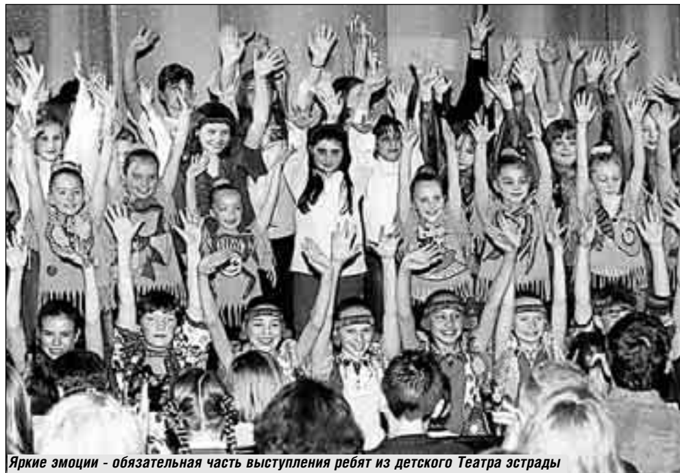
Яркие эмоции – обязательная часть выступления ребят из детского Театра эстрады

- А бывает так: вы видите, что ребенок не рвется заниматься музыкой, но его родители из собственных амбиций настаивают?