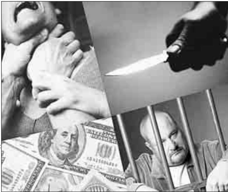
КОЛЛАЖ АЛЕКСАНДРА МАТУШКИНА

Киллеры продолжали ездить в Порядковый переулок, где жил коммерсант, как на работу. Подходящего момента для того, чтобы выполнить заказ, не представлялось. И тут наступили форс-мажорные обстоятельства. Коммерсант, слов-