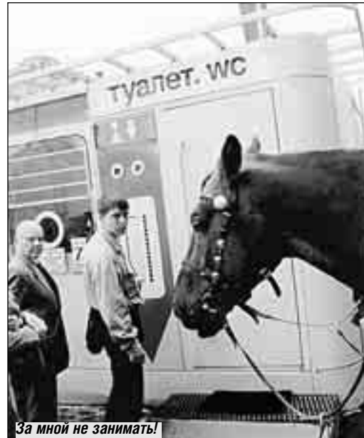
За мной не занимать!