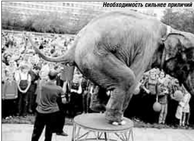
Необходимость сильнее приличий

Евгений КРУШЕЛЬНИЦКИЙ