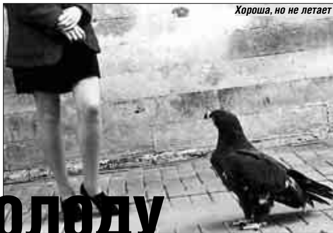
Хороша, но не летает

Кстати, эти знающие себе цену зверьки устроились едва ли не лучше всех. Те, кто имеет хозяина с кварти-