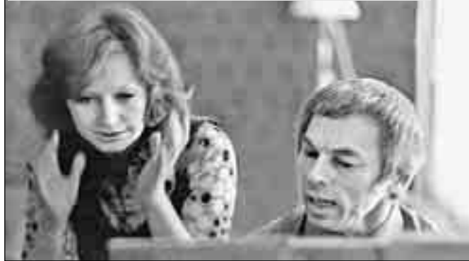
Вот так когда-то Александр Зацепин разучивал свою очередную песню с начинающей певицей Аллой Пугачевой.

Кто не знает песен композитора Александра Зацепина к фильмам «Кавказская пленница», «Бриллиантовая рука», «Земля Санникова», «Иван Васильевич меняет профессию», «31 июня», «Женщина, которая поет» и еще к доброй сотне картин! Зацепину во многом обязаны эстрадной карьерой Алла Пугачева, Яя Илоа, Нина Бродская, Аида Ведищева, Татьяна Анциферова, Жанна Рождественская и еще многие наши звезды. Композитор уже давно живет попеременно в двух странах: то во Франции, то в России. Нам удалось побеседовать с ним в один из его последних приездов в Москву.