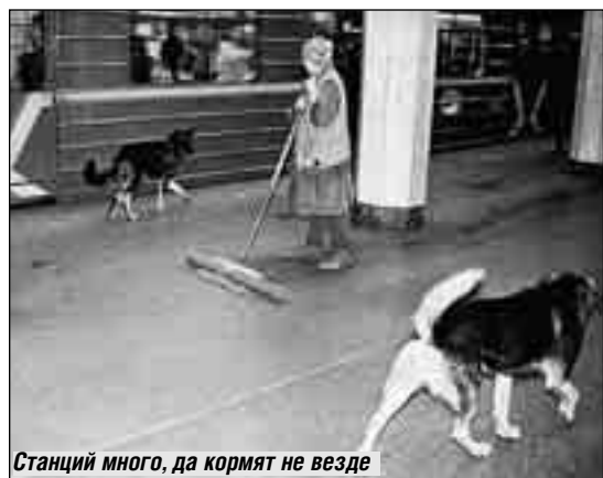
Станций много, да кормят не везде

Бродячие собаки научились пользоваться метрополитеном: спускаются по лестницам вниз, садятся в поезд и едут по своим делам, а по пути попрошайничают. Говорят, некоторые даже выходят на «своей» станции, где сердобольные горожане припасают для них что-нибудь съедобное.