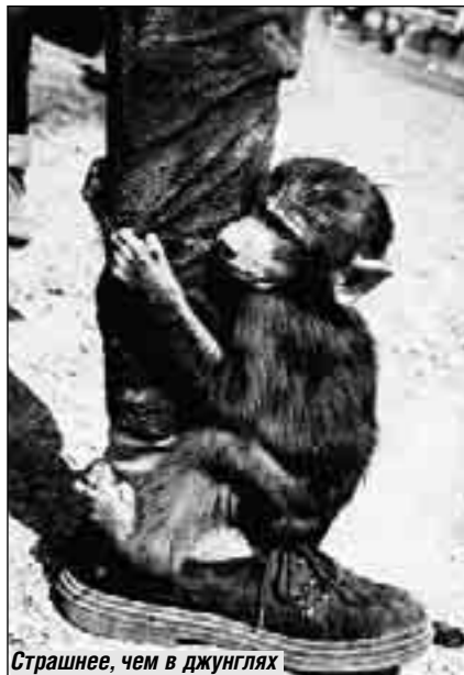
Страшнее, чем в джунглях