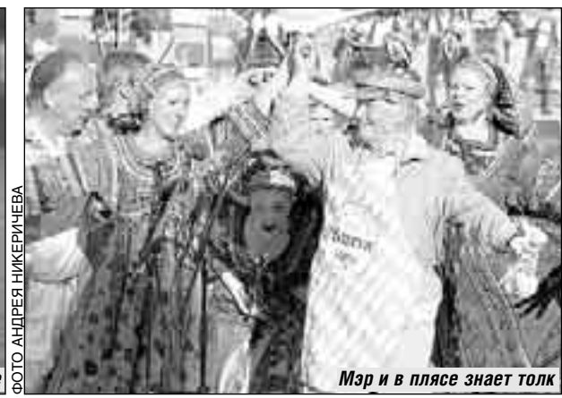
Мэр и в плясе знает толк