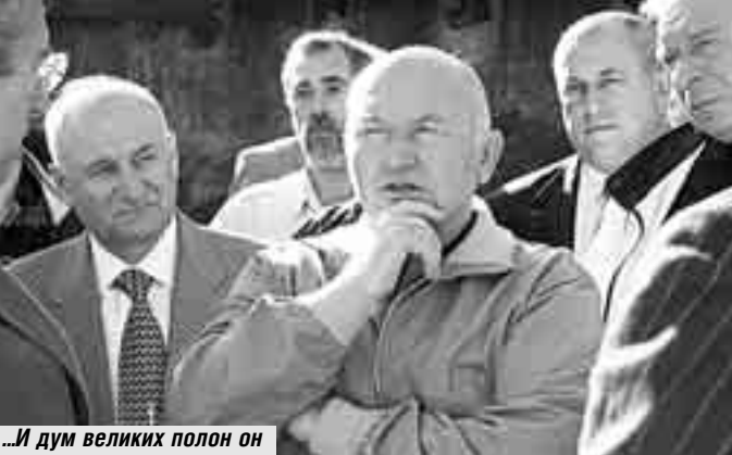
...И дум великих полон он

Можно назвать целый ряд и других важных для Москвы проблем: развитие энергетики, улучшение экологии, обеспечение города дошкольными учреждениями, регулирование миграционных процессов - каждая из них может считаться приоритетной для власти. Но решаем мы их комплексно, поэтапно, и предстоящий четырехлетний срок Юрия Лужкова на посту мэра будет очередным этапом реализации уже принятых и новых планов для того, чтобы Москва процветала, развивалась гармонично, а качество жизни москвичей повышалось.