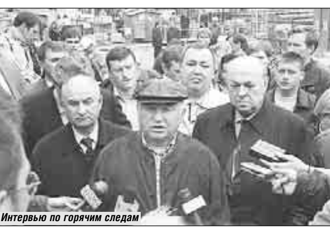
Интервью по горячим следам