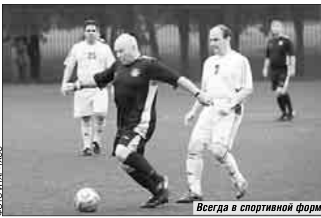
Всегда в спортивной форме