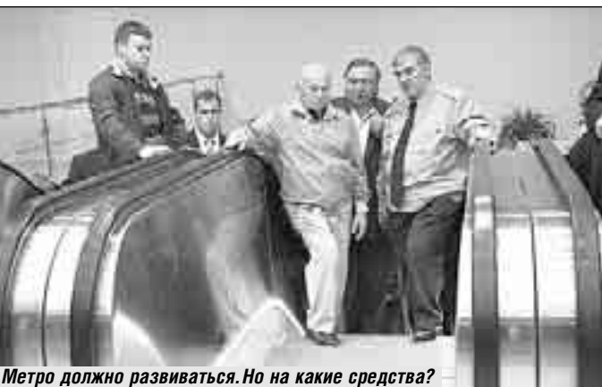
Метро должно развиваться. Но на какие средства?