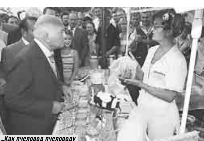
...Как пчеловод пчеловоду