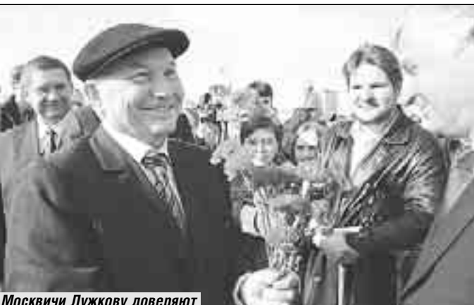
Москвичи Лужкову доверяют