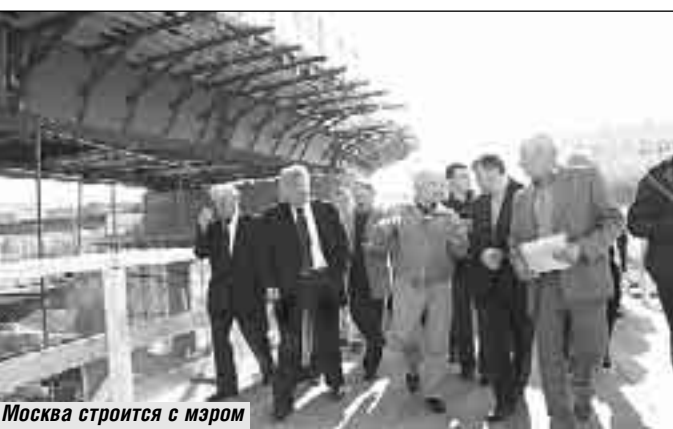
Москва строится с мэром