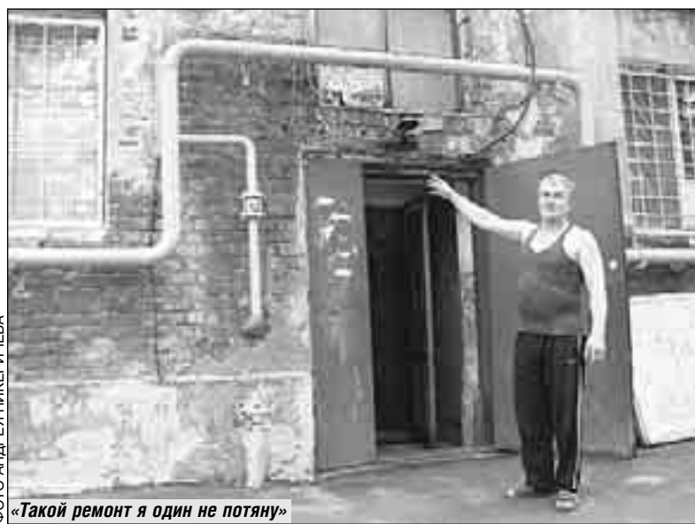
«Такой ремонт я один не потяну»

Итак, можно выделить три категории домов: существующая застройка в более-менее приличном состоянии; строения, в