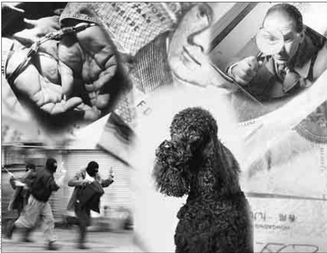
КОллаж Андрей Никеричева

Шерсть любимой собаки налетчика стала одним из главных доказательств его участия в преступлениях