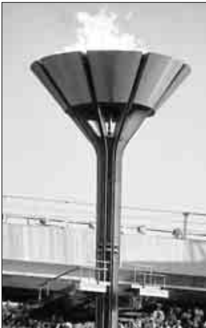
Москва передает эстафету Сочи: кому посчастливилось зажечь олимпийский огонь?

На заседании 119-й сессии Международного олимпийского комитета (МОК) столицей зимних Олимпийских игр 2014 года провозглашен российский город-курорт Сочи.