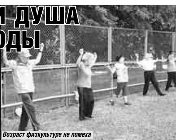
Возраст физкультуре не помеха

- Люди приезжают в Лужники, как в клуб, ведь многие из них одиночки, а здесь находят отдушину, можно