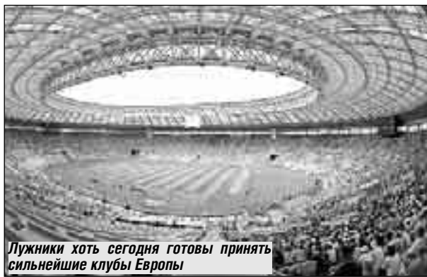
Лужники хоть сегодня готовы принять сильнейшие клубы Европы

Кстати, билеты на финал Лиги чемпионов - прерогатива Российского футбольного союза. Насколько знаю, большая часть будет реализована нашим болельщикам, приоритет и за фанатами тех клубов, которые выйдут в финал. Квоту имеют и все пятьдесят две европейские национальные федерации футбола. Уже сейчас ощущается некий ажиотаж: нам звонят даже из-за рубежа, просят зарезервировать места на трибунах... Я вижу, как заинтересован город в проведении столь грандиозного спортивного со-