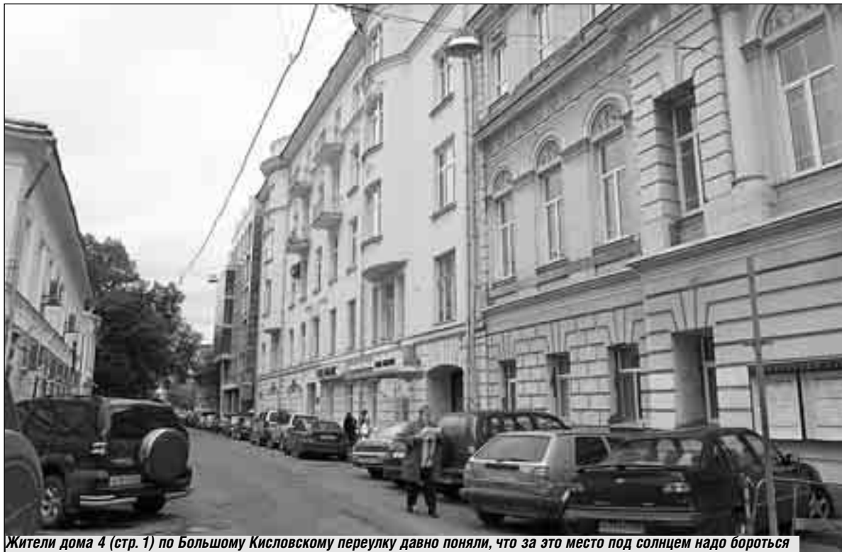
Жители дома 4 (стр. 1) по Большому Кисловскому переулку давно поняли, что за это место под солнцем надо бороться

В начале 2006 года истек срок действия инвестиционного контракта и постановления правительства Москвы (ППМ), которое два раза еще и продлевалось. Однако