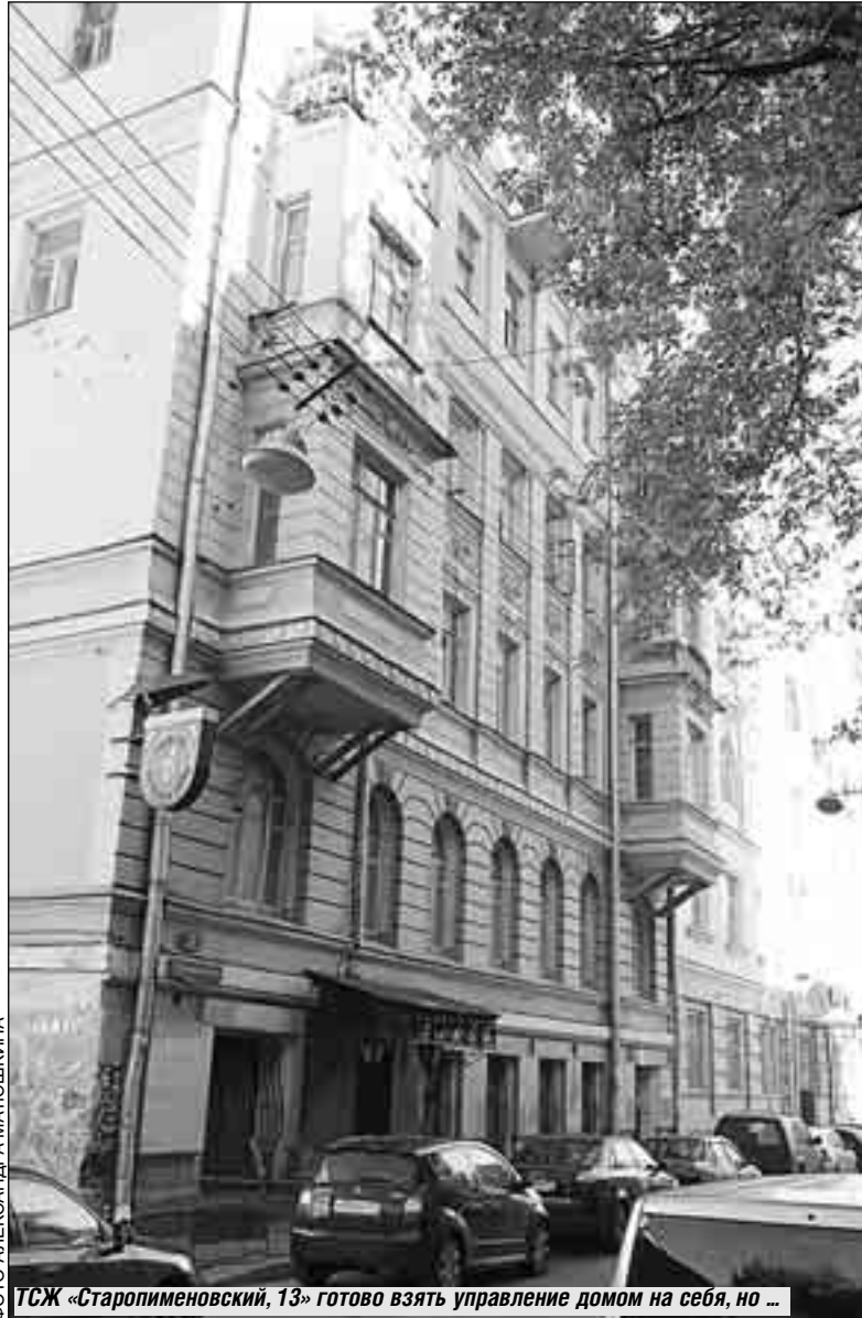
ТСЖ «Старопименовский, 13» готово взять управление домом на себя, но ...

вления публичных услуг: регистрацию прав, оформление земельных участков, согласование проектов и технических условий. А когда нет веры чиновникам - нет и мотивации к самоуправлению. Собственники жилья не являются реальными хозяевами дома и его совладельцами. Скорее они собственники «виртуальные». Дома так и остались на балансе ДЕЗов, земля не является частью единого земельного имущества комплекса (многоквартирный дом), который не зарегистрирован в Едином государственном реестре прав.