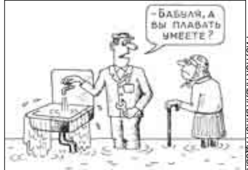
РИСУНОК ПАВЛА ВИНЮГРАДОВА

А прораб нам сказал, что мы разгильдяи и лихоемцы! И так он вдруг разошелся, что ногами затопал. Монтажник Серега хотел предупредить его, что бетонные перекрытия он до монтажа обменял на воду, но тут все рухнуло, и до нас донеслись мольбы о помощи. Когда пыль осела, мы увидели, что монтажник зацепился курткой за арматуру, а прораб висит на монтажке.