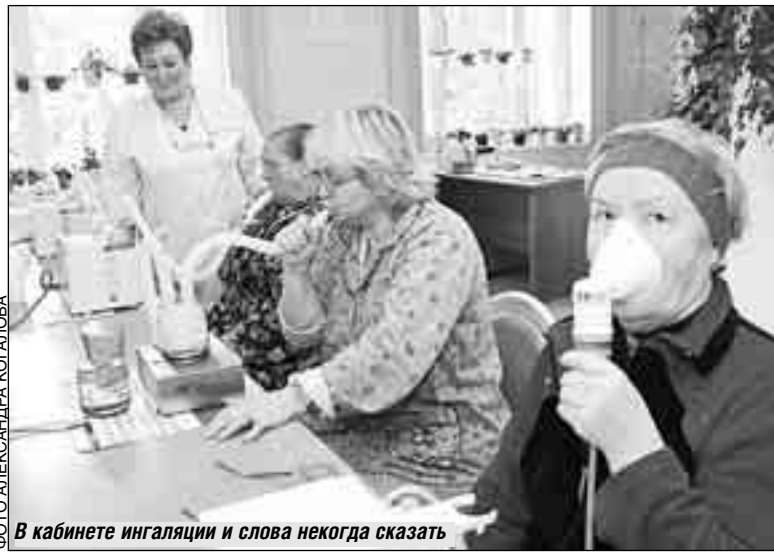
В кабинете ингаляции и слова некогда сказать

...В этой клинике больные не лежат в коридорах - на сей счет существует жесткое распоряжение главного врача. Больница плановая - то есть каж-