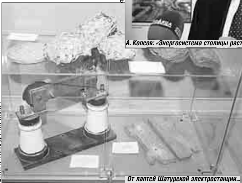
От лаптей Шатурской электростанции...

Конечно, юбилей - не только повод для раздумий о том, что было и что стало. Но и возможность отвлечься от повседневных забот. Гости и участники мероприятия задержались на фуршет, во время которого всем желающим предоставляли на прокат