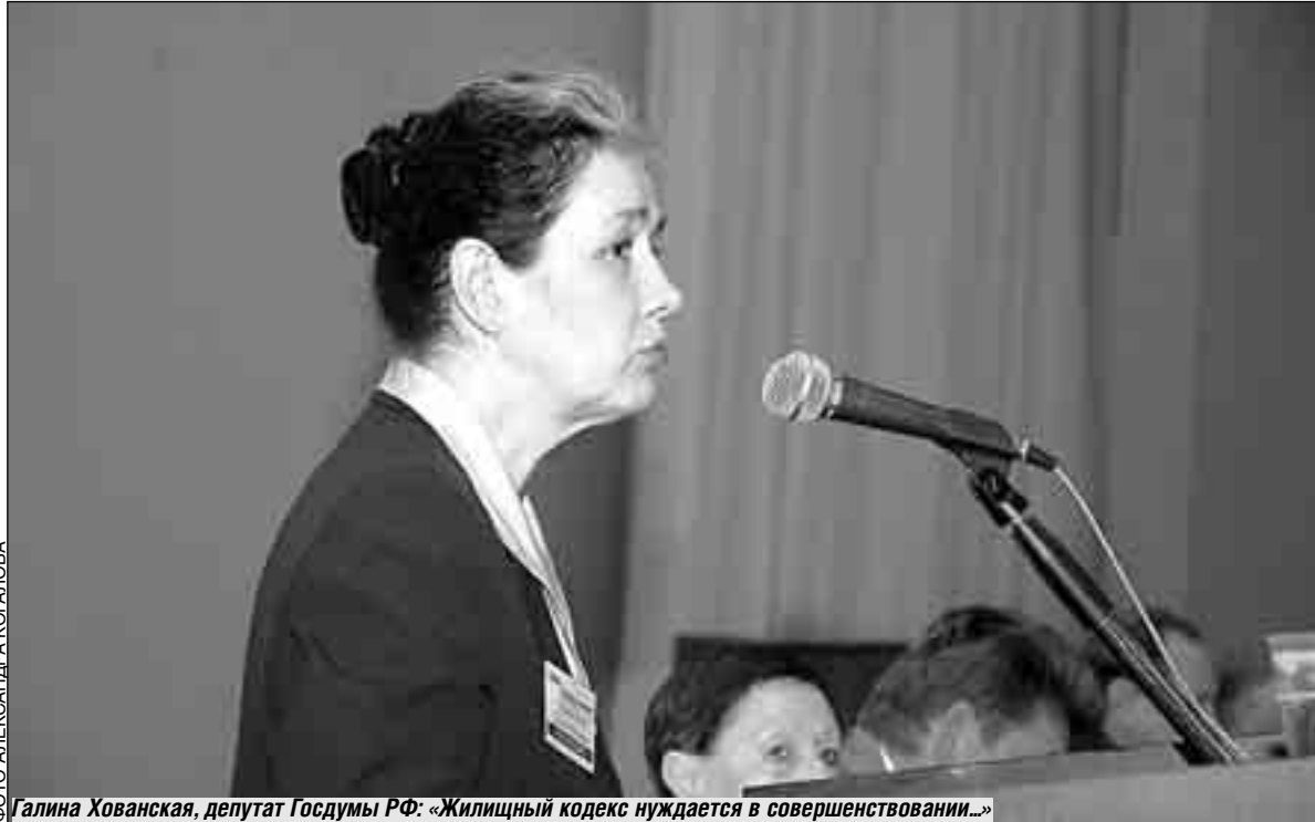
Галина Хованская, депутат Госдумы РФ: «Жилищный кодекс нуждается в совершенствовании...»

У автора этого обзора задача скромнее - на сравнительно небольшой газетной площади показать наиболее горячие узловые точки и проблемы, которые сейчас волнуют тех, кто анализирует ход реформы ЖКХ и предлагает выходы из постоянно возникающих непростых ситуаций. В этой сфере мы идем путем новым, неизведанным, а потому используем традиционный, к сожалению, для нас метод проб и ошибок. Глав-