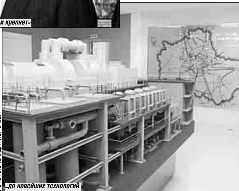
...до новейших технологий