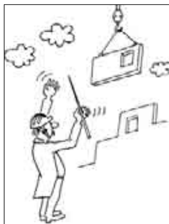
РИСУНОК ПАВЛА ВИНЮГРАДОВА