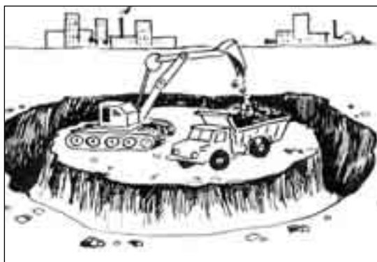
РИСУНОК ПАВЛА ВИНЮГРАДОВА

— Бань-я! — хвастило сказал вожак инопланетян.