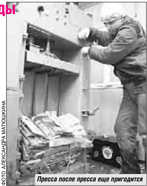
Пресса после пресса еще пригодится

Что касается стационарных и мобильных пунктов, принимающих вторсырье у населения, то их в ЦАО немного. Ниже приведены их координаты: