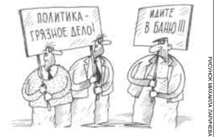
РИСУНОК МИХАИЛА ЛАРИЧЕВА