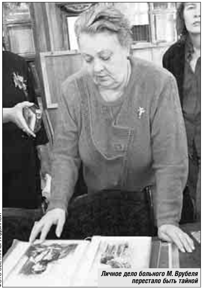
Личное дело больного М. Врубеля перестало быть тайной