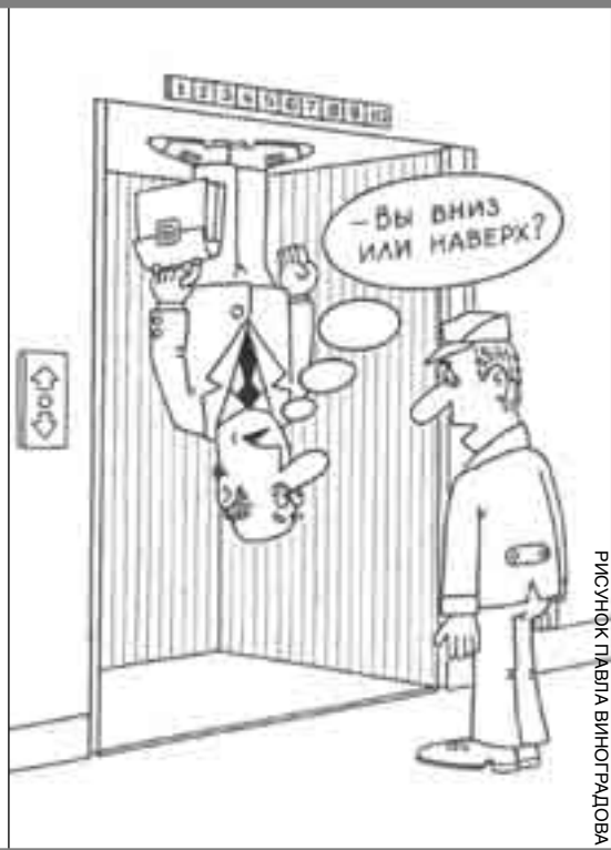
РИСУНОК ПЯВИЛА ВИНЮГАНОВА