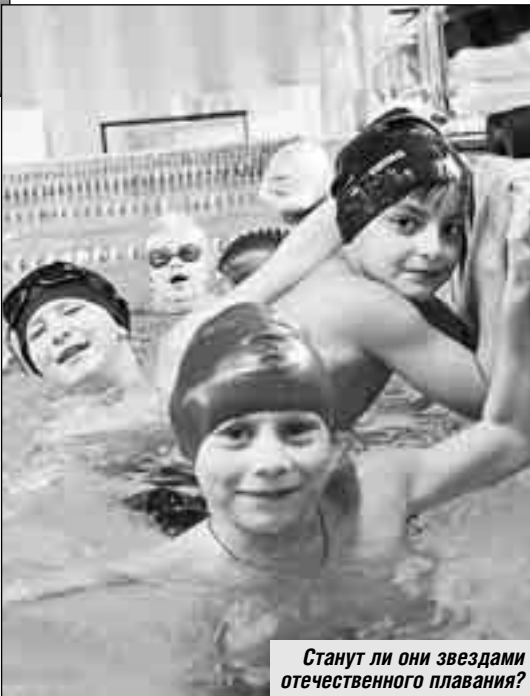
Станут ли они звездами отечественного плавания?

А днем раньше мини-ватерполисты ДЮСШ № 82 примут ровесников из других московских спортшкол в рамках однодневного турнира, по сути, чемпионата столицы. Любопытная эта забава - мини-ватерпол! Каждая из соперничающих команд выставляет четырех полевых игроков (плюс голкипер) и гоняют мяч по водной глади вдвое меньше обычных размеров - 14x12,5 метра. Сет (система розыгрыша почти аналогична теннисной) длится до четырех забитых мячей в ворота одной из команд. Если счет по сетам равный, проводится решающий, третий. К слову, на недавнем первенстве страны в Туапсе мини-ватерполисты ДЮСШ № 82 заняли 7-е место из 17 участников - результат неплохой.