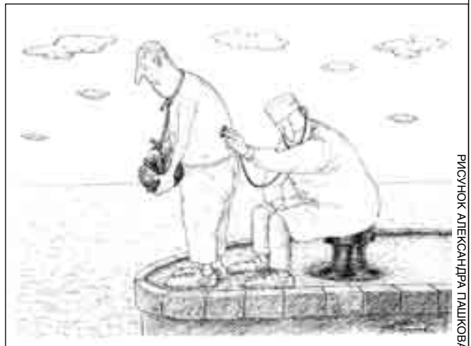
РИСУНОК АЛЕКСАНДРА ГЛЫШКОВА