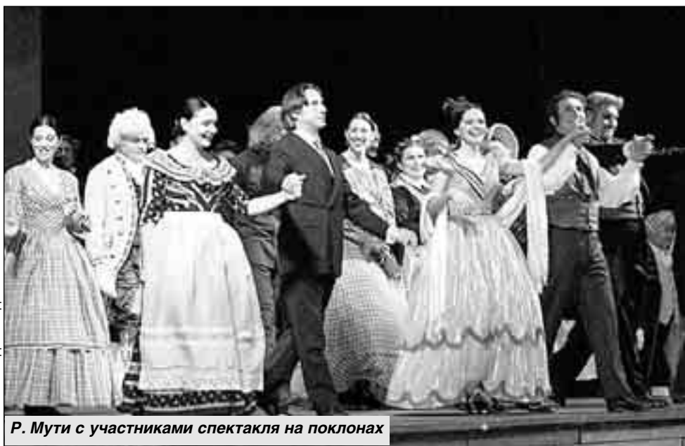
Р. Мути с участниками спектакля на поклонах