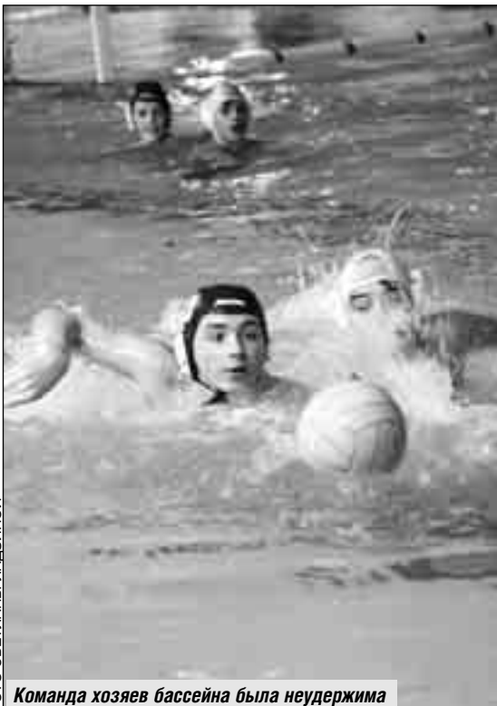
Команда хозяев бассейна была неуправляема