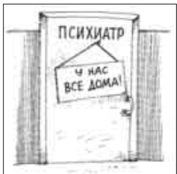
РИСУНОК МИХАИЛА ПАРЧЕНЕВА