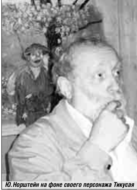
Ю. Норштейн на фоне своего персонажа Тикусая

Москвичам представляется редкий случай увидеть экранизированную японскую поэзию в уникальном анимационном фильме «Зимние дни». В его основе знаменитый поэтический цикл Мацуо Басё, а создавали картину 35 самых знаменитых аниматоров. Помимо японских режиссеров среди них Рауль Серво («отец» бельгийской мультипликации), чех Бретислав Поляр, три обладателя «Оскара» – Ко Хоедман, Марк Бэйкер и наш соотечественник Александр Петров. Но первое слово в фильме принадлежит Юрию