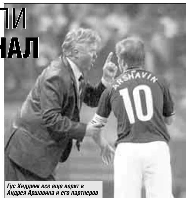
Гус Хиддинк все еще верит в Андрея Аршавина и его партнеров