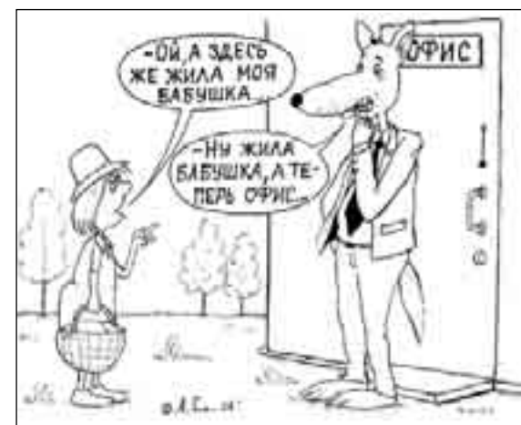
РИСУНОК А. САЛАМАТИНА