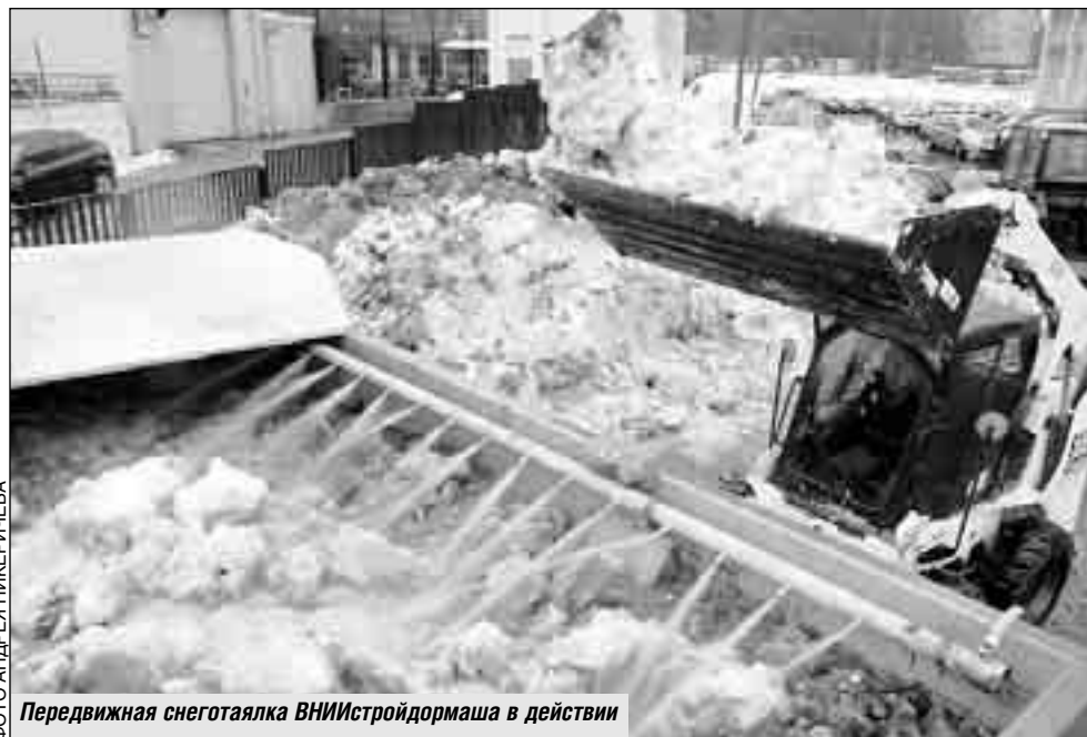
Передвижная снегоотвалка ВНИИстройдормаша в действии

Руководство многих столичных административных округов уже проявляет серьезный интерес к новинке, которая может стать незаменимой для коммунальных работников. Приобрести такую технику хотели бы и крупные подрядные организации, тем более что цена отечественных снегоотвалов в несколько раз ниже, чем импортных. Более мелкие фирмы могли бы обзавестись ими на условиях лизинга.