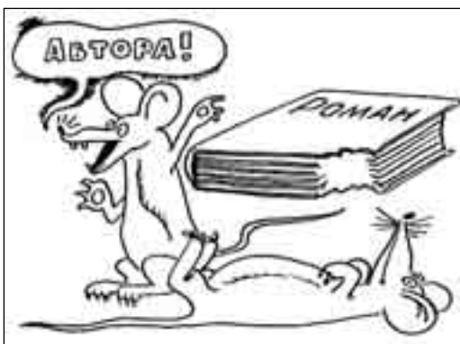
РИСУНОК ПАВЛА ВИНОГРАДОВА