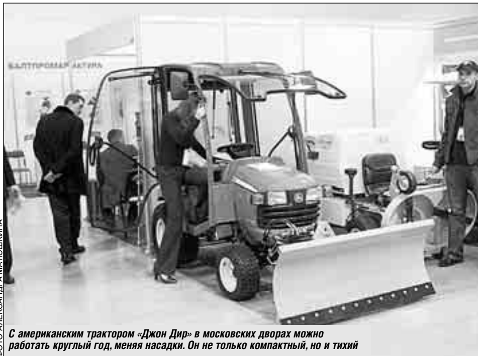
С американским трактором «Джон Дир» в московских дворах можно работать круглый год, меняя насадки. Он не только компактный, но и тихий

Что и говорить, импорт явно доминировал в экспозиции, хотя бы на уровне комплектующих элементов. Наверное, международная интеграция и равнение на лучшие модели - дело полезное. Но все же хотелось бы видеть больше оригинальных российских разработок, воплощенных в металл, пластик или сложную электронику на отечественных предприятиях.