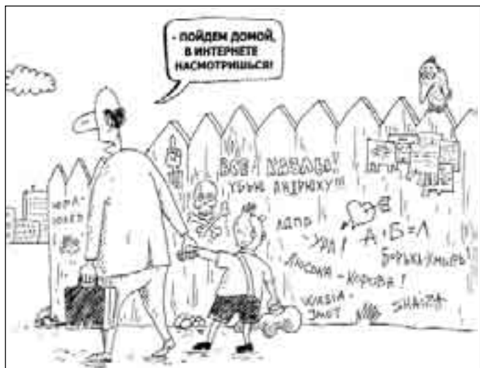
РИСУНОК В. МАРАЧЕНКО