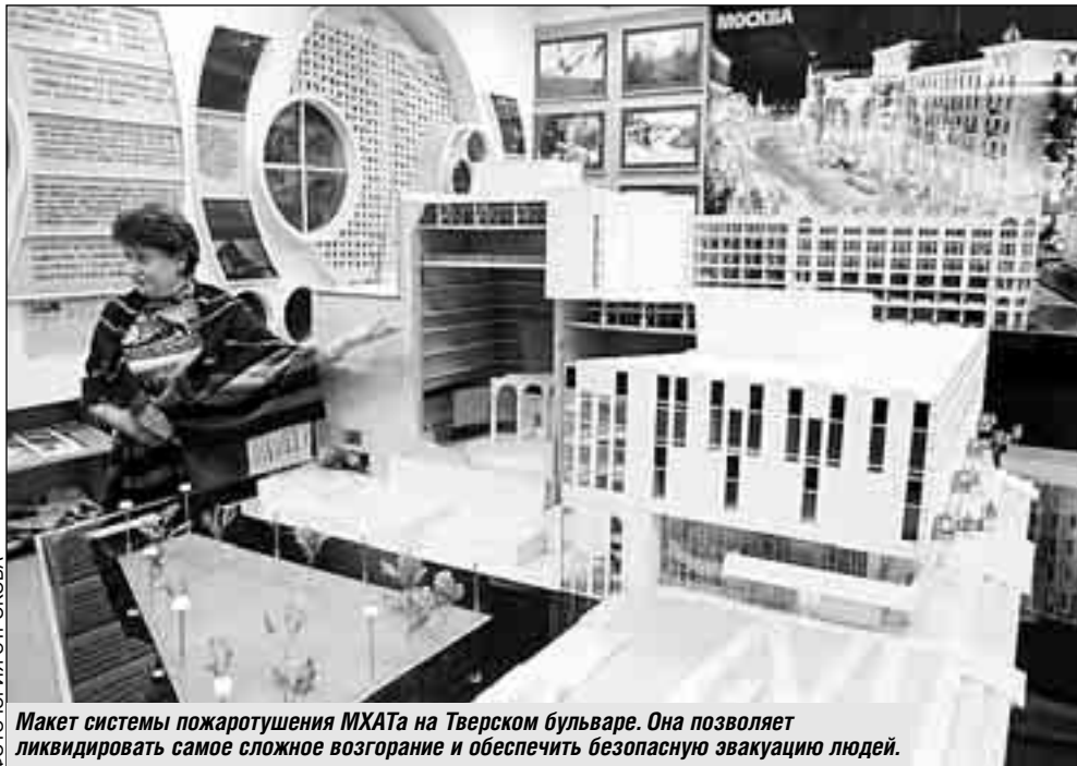
Макет системы пожаротушения МХАТа на Тверском бульваре. Она позволяет ликвидировать самое сложное возгорание и обеспечить безопасную эвакуацию людей.