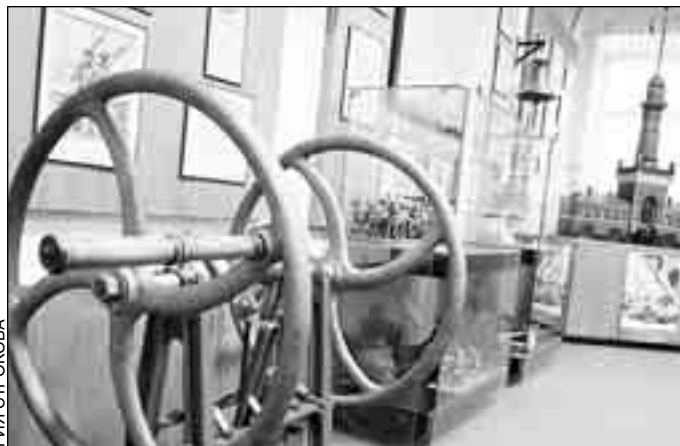
Выставочная экспозиция ГУ МЧС России по г. Москве демонстрирует образцы пожарной техники и оборудования.

Но лишь только порывы ветра уносили с глаз долой последние искры пожара, погорельцы брались за те же самые багры и топоры, чтобы строить заново. Видать, эти две профессии на Москве возникли одновременно: всем миром строились, всеми миром спасали возведенное от огня.