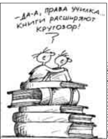
РИСУНОК МИХАИЛА ЛАРИЧЕНА