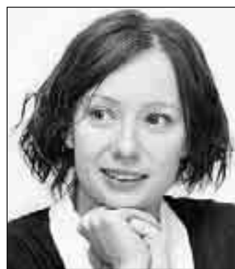
вам, где и как можно сдать кровь для детей, больных раком.

- Мне кажется, это потрясающая часть моей профессии - быть полезной. Для чего еще жить на земле? Мы все удем отсюда, мы все здесь временно. Я, наверное, эгоистка, и просто получаю от этого удовольствие. Какое-то невероятное удовольствие оттого, что вижу детей, которые летят и выписываются. У меня поднимается настроение, как поднимается оно у родителей детей, которые знают: их не бросят один на один с горем. Они так смотрят, что становится не нужна вся эта мишура, связанная с понятием «популярная артистка». Вот что делает меня счастливой.