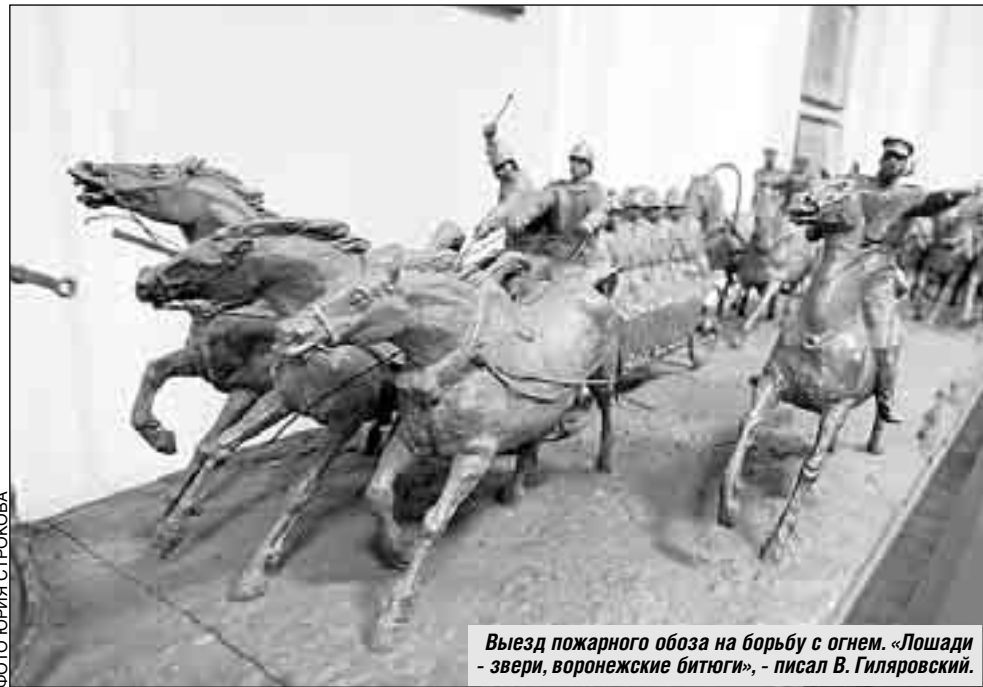
Выезд пожарного обоза на борьбу с огнем. «Лошади-звери, воронежские битюги», - писал В. Гиляровский.