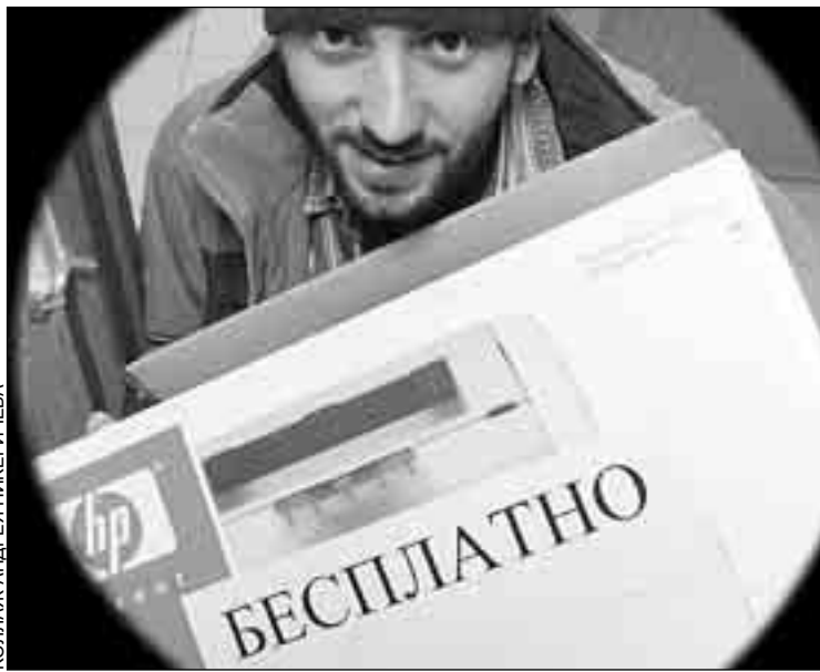
КОЛЛАЖ АНДРЕЯ НИКЕРИЧЕВА

Четыре цыганки из Владимирской области отняли последние деньги у московских пенсионеров. Представляясь сотрудницами собеса, женщины беспрепятственно входили в квартиры пожилых жителей столицы. А затем вместе с «социальными работницами» из домов исчезали деньги и золотые украшения. Аналогичным образом действовал мошенник, представлявшийся сотрудником военкомата.