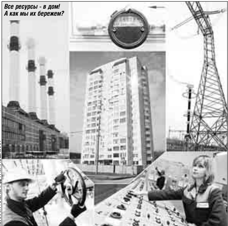
КОЛЛАЖ АЛЕКСАНДРА МАТЮШКИНА

Абонентская плата за неограниченный объем местных телефонных соединений в Москве действительнее выше, чем в других субъектах Центрального и Северо-Западного округов, хотя и не самая высокая в стране. Однако более 894 тысяч абонентов (ветераны, неработающие пенсионеры, инвалиды ВОВ и т.д.) получают у нас ежемесячные компенсации по оплате за пользование телефоном в сумме 190 рублей в месяц независимо от выбранного ими тарифного плана. Для сравнения: абонентская плата за телефон в Смоленске - 228,5, Новгородской области - 288,87, Вологодской области - 295 руб. в месяц.