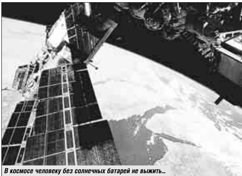
В космосе человеку без солнечных батарей не выжить...

- Для ЖКХ эти источники весьма эффективны, - убежден Сергей Филатов. - Их энергией можно освещать не только подъезды, прочие общие помещения дома, но и, к примеру, подпитывать электросчетчики, автоматические ворота во дворе, датчики движения, аккумуляторы. Словом, использовать во всех случаях, когда электрической сети требуется помощь.