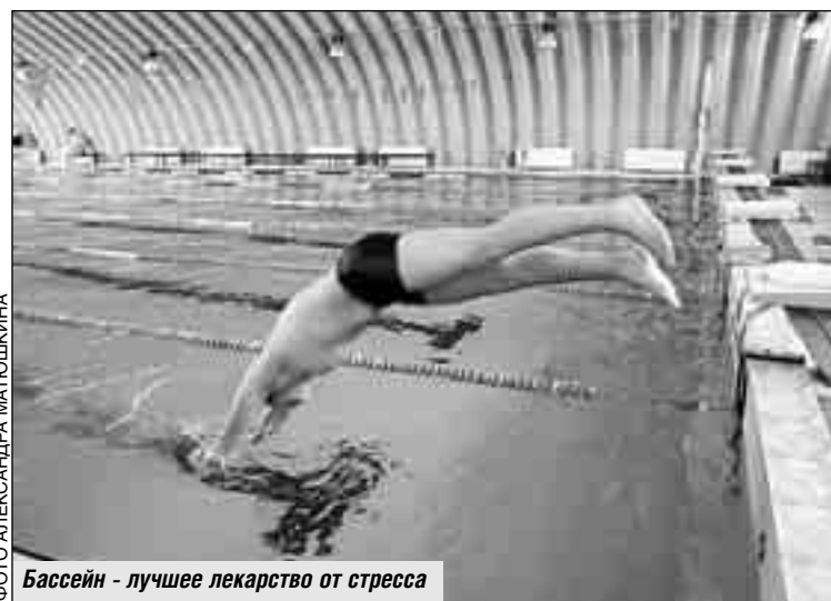
Бассейн – лучшее лекарство от стресса