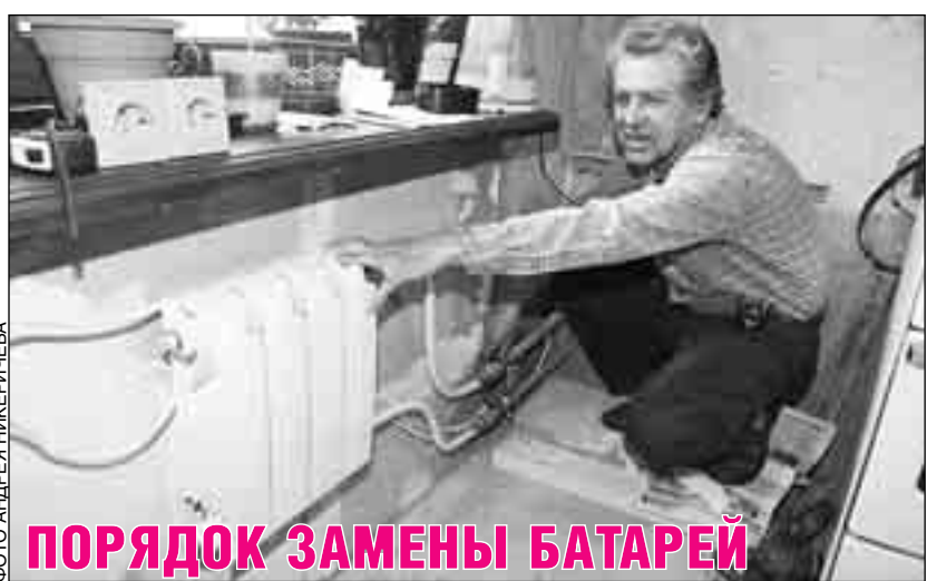
ПОРЯДОК ЗАМЕНЫ БАТАРЕЙ

торгнуть трудовой договор, предупредив об этом работодателя в письменной форме не позднее чем за две недели, если иной срок не установлен ТК РФ или иным федеральным законом. Сокращенного срока предупреждения работодателя об увольнении для работающих студентов законодательством РФ не предусмотрено. Но здесь следует помнить, что в соответствии с ч. 2 ст. 80 ТК РФ по соглашению между работником и работодателем трудовой договор может быть расторгнут и до истечения срока предупреждения об увольнении.