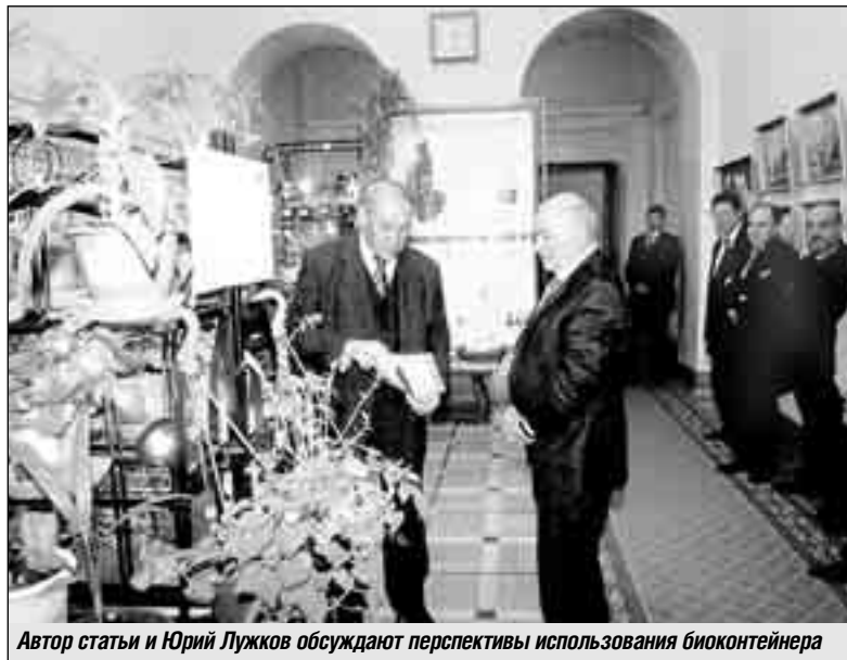
Автор статьи и Юрий Лужков обсуждают перспективы использования биоконтейнера

Высокие урожаи качественного картофеля в хозяйствах поставщиков при любых погодных условиях - главное условие устойчивого снабжения москвичей этим продуктом. Однако его урожайность в России составляет лишь половину среднеевропейской: 12 тонн с гектара, и хотя тут имеется определенный рост, он весьма незначителен.