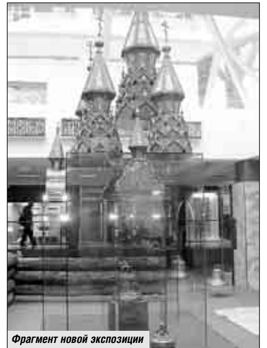
Фрагмент новой экспозиции