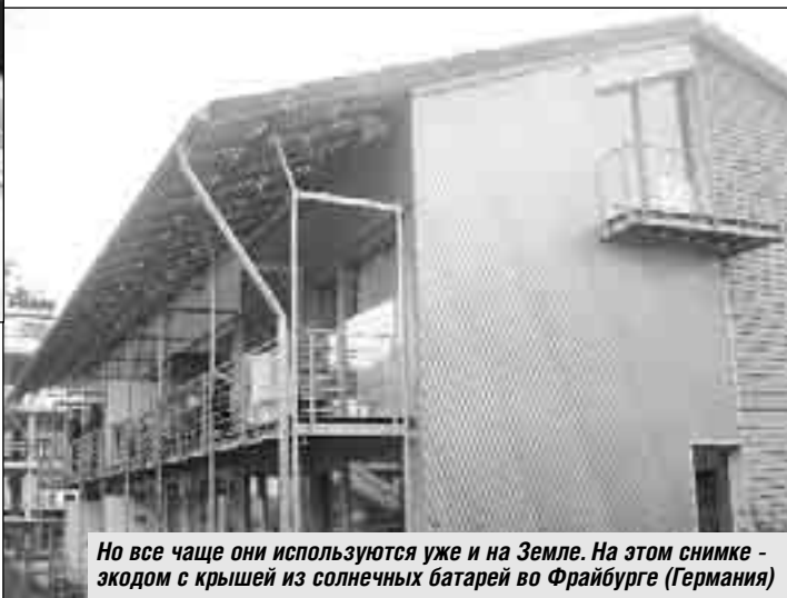
Но все чаще они используются уже и на Земле. На этом снимке - экодом с крышей из солнечных батарей во Фрайбурге (Германия)

бался на уровне 6 киловатт в час, то теперь он сократился до 0,4-0,8 киловатта. Экономия для одного подъезда составляет 74 тысячи рублей в год.