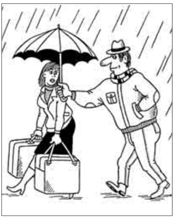
РИСУНОК ПАВЛА ВИНЮГРАДОВА