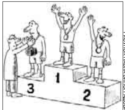
РИСУНОК ПЯВЛА ВИНГРАДОВА