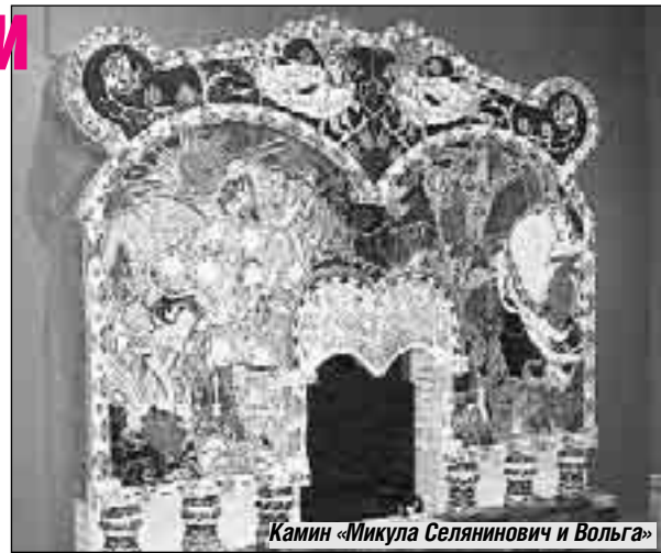
Калмин «Микола Селянинович и Вольга»

Нынешняя экспозиция, однако, далеко не полная. Часть известных произведений, среди которых «Сирень» и «Демон сидящий», отправлена на выставку в Бонн. Но зато здесь появились новые работы, ранее не выставленные. Самое эффектное и притягательное - великолепный майоликовый калмин «Микола Селянинович и