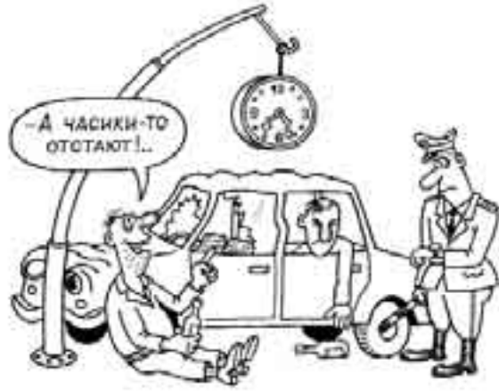
РИСУНОК ПАВЛА ВИНЮГРАДОВА