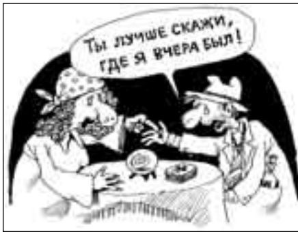
РИСУНОК ВЛАДИМИРА ИВАНОВА

«Нет, так не пойдет, - твердо решил Матюнин. - Схожу-ка к психиатру. Иначе и свихнуться недолго». По дороге хулиганы попросили у него закурить, дали в глаз и отняли деньги.