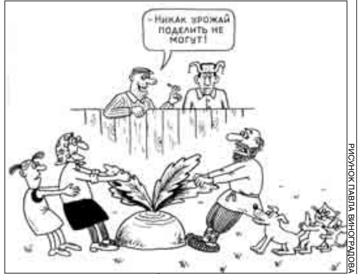
РИСУНОК ПАВЛА ВИНЮГРАДОВА

«Не случайно вчера все утро над ними кружил самолет», — подумал Фуражкин и с завистью посмотрел на один из участков с противотанковыми на-