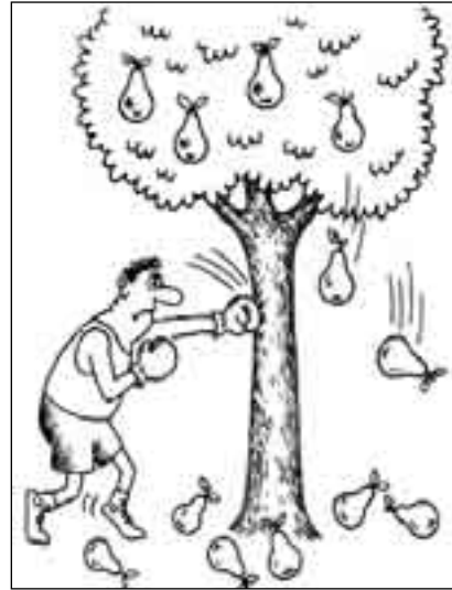
РИСУНОК ПАВЛА ВИНЮГРАДОВА

НОВИНКИ. Этим летом селекционеры Обалдуевска вывели и посадили весной новинки, которые должны были помочь сохранить весь урожай. Малину с ядовитыми колечками парализующего действия, которую рекомендуют посадить по периметру дачного участка, клубнику, бьющую током, гладиолусы с ядовитым ароматом нервнопаралитического действия, лопухи-людоеды, бросающиеся на чужих. Вопрос теперь в том, как убрать все это с вашего участка.