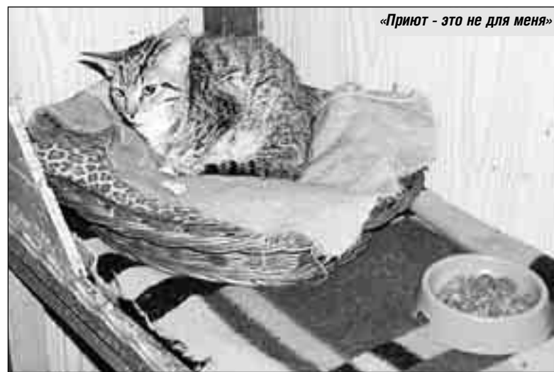
«Приют - это не для меня»

ном - то есть постоянный, верный. Однажды на месте, где он дежурил, появился листок со словами: «Псу, научившему нас любви и преданности». А потом собрали денег, и теперь на обочине стоит памятник Косте. Он по-прежнему смотрит на дорогу.