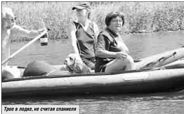
Трое в лодке, не считая спаниеля