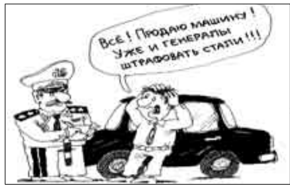
РИСУНОК ВЛАДИМИРА ИВАНОВА