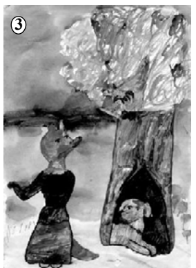
3. «Лиса и петух». Рис. Виталия Комарова.

Страничку подготовила Татьяна МЕШАЛКИНА.