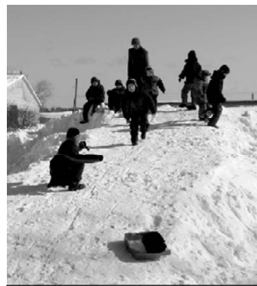
На снимках: вверху - ребятишки катаются с горки на чем только можно; внизу - кто-то печет блины?