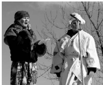
Участники театрализованного представления.