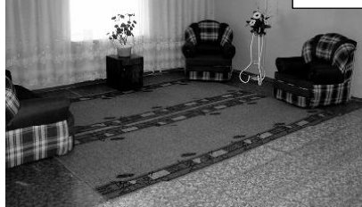
Снимки сделаны в отделе временного проживания ЦРБ.

Ветеранам и малоимущим бесплатно выписаны газеты «Северная правда», «Достоинство», «Районный вестник». Работниками РКДЦ, отде-