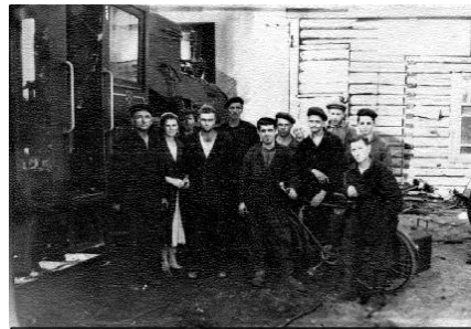
На снимках: слева - коллектив депо Якшангского леспромпхоза, 1957 год; справа - паровоз на узкоколейной железной дороге леспромпхоза, 1959 год.

С открытием Северного попутку сырья на стороне прекратили.